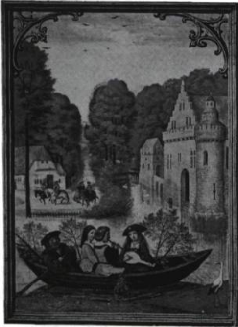
Moyen Âge. Enluminure tirée d'un bréviaire flamand, les Heures de la Vierge , vers 1515.

correspondait exactement au nombre de rédacteurs, et la teneur de chacune convenait, du reste, aux préoccupations de l'un ou de l'autre. Notre projet final attribuait ainsi à chaque rédacteur une «tâche» que nous lui avons concoctée à son insu, et que tous ont acceptée de bonne grâce, nous offrant même leur aide quant à la formulation des questions de la section qu'ils s'étaient engagés à ouvrir 4 . Voulant sonder l'ensemble du milieu culturel, nous n'avons que très peu fait appel à nos collaborateurs réguliers; nous avons sollicité, dans un souci de réunion et de reconnaissance, tous les anciens rédacteurs de Jeu (on trouvera ci-après un tableau chronologique des vingt-huit personnes qui ont décidé des orientations de la revue depuis le début), des collaborateurs très proches qui ont pris une part active à l'élaboration de certains de nos dossiers, et nous nous sommes tournés, pour le reste, vers des voix entièrement nouvelles. La requête que nous adressions à chacun était précise; malgré tout, nous voulions qu'ils se sentent libres d'y répondre de la façon qui leur convenait, que, se laissant prendre au jeu, ils profitent de cette «commande» inattendue pour se laisser aller à rêver avec nous. Ce numéro anniversaire, nous le voulions éclaté, festif, mais aussi, riche, stimulant, nourrissant. L'apport de chacun, à cet égard, fut infiniment précieux: nous les en remercions 5 .