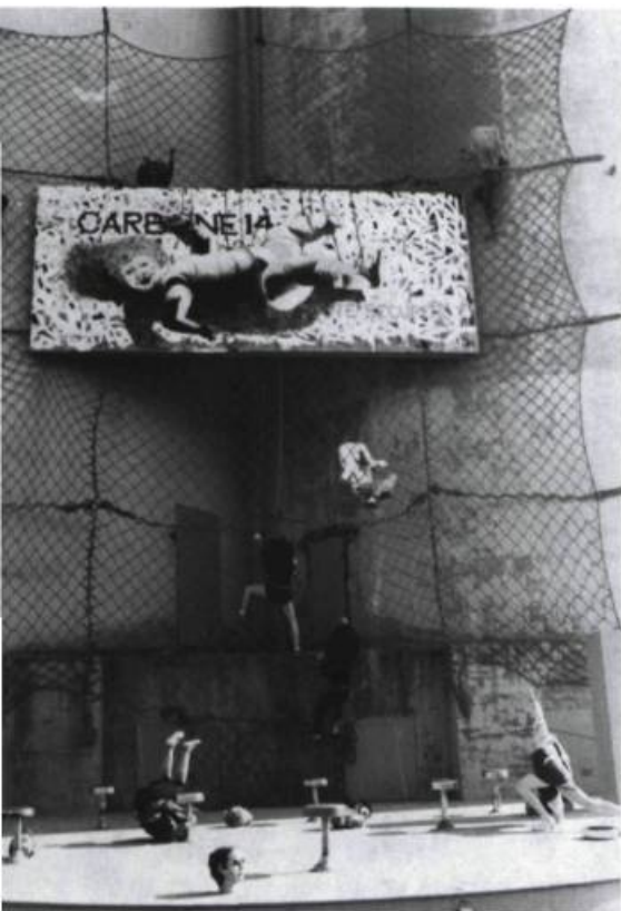
Dans la ville d'aujourd'hui : En toute sécurité , de Carbone 14.

situer chacun — la diversité de nos collaborateurs et leur nouveauté dans Jeu l'imposait —, une courte note biographique précède chaque collaboration : de cette façon, on pourra identifier chaque fois qui parle. Le caractère réflexif de la plupart des textes nous a également forcés à en repenser l'illustration. L'iconographie a une grande place dans Jeu : elle constitue une trace à laquelle nous tenons. Comme le sujet global du numéro quitte cette fois le particulier, nous avons pensé mettre à contribution des images d'autres époques, d'autres lieux et d'autres disciplines : traces de l'activité artistique qui, au fil des temps, a contribué à faire de nous ce que nous sommes.