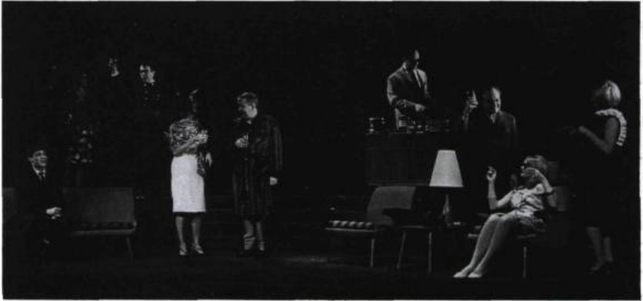
Un père des années soixante. Jean Duceppe dans les Beaux Dimanches, de Marcel Dubé, créés en 1965: «les vieux bourgeois faisaient face aux jeunes idéalistes». Une image typique...