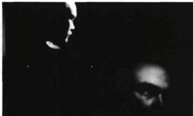
Une scène de Woyzeck .

Malgré tout, je crois qu'il est possible pour un comédien de devenir à l'aise dans une interaction avec l'holographie, car une fois celle-ci démystifiée (ce qui est relativement facile), elle devient un champ d'exploration comme un autre au théâtre. C'est précisément ce type d'interaction, je crois, que l'on trouvera éventuellement le plus intéressant, tant pour les comédiens impliqués que pour les spectateurs.