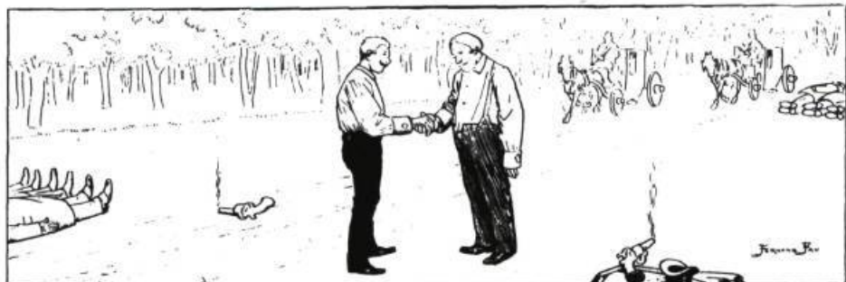
«Une affaire d'honneur», dessin humoristique de Fernand Fau. Le public comme juge d'un duel qui se joue entre praticien et critique?...