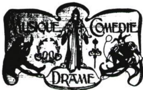
L'en-tête de la chronique de théâtre de la Presse au début du siècle.

s'élargit, elle devint le juge des productions esthétiques, faisant du « bon goût » une norme et de l'objectivité, un critère, dans le but de combattre l'émergence d'une parole populaire — puis d'une parole féminine — dans le champ des productions esthétiques. Avec l'intégration d'une part de plus en plus grande des activités culturelles dans l'économie marchande, jusqu'à constituer une industrie de la culture, la critique est refoulée. L'esthétique n'est que cette nouvelle forme d'autojustification qui masque le désarroi d'une pratique condamnée à disparaître sous l'effet d'une gestion de la consommation et du public à l'enseigne de la publicité, des statistiques et des sondages. L'opinion publique, au XX e siècle, est devenue cette masse informe et anonyme de la moyenne normalisée. Épurée de toute volonté critique et, ce qui est pire, de toute parole énoncée dans une quelconque forme discursive, l'opinion n'est plus que le silence. Elle est parlée par la voix des analystes financiers, des spécialistes en relations publiques, des bureaucrates et des politiciens. Les artistes et les critiques peuvent bien s'acharner à défendre des valeurs, à représenter des collectivités ou des publics spécifiés par leur formation et par leurs croyances, cela n'empêchera pas Ding et Dong de faire fortune en remplaçant les fictions par des jeux de mots et en donnant au théâtre la dimension d'un sketch publicitaire.