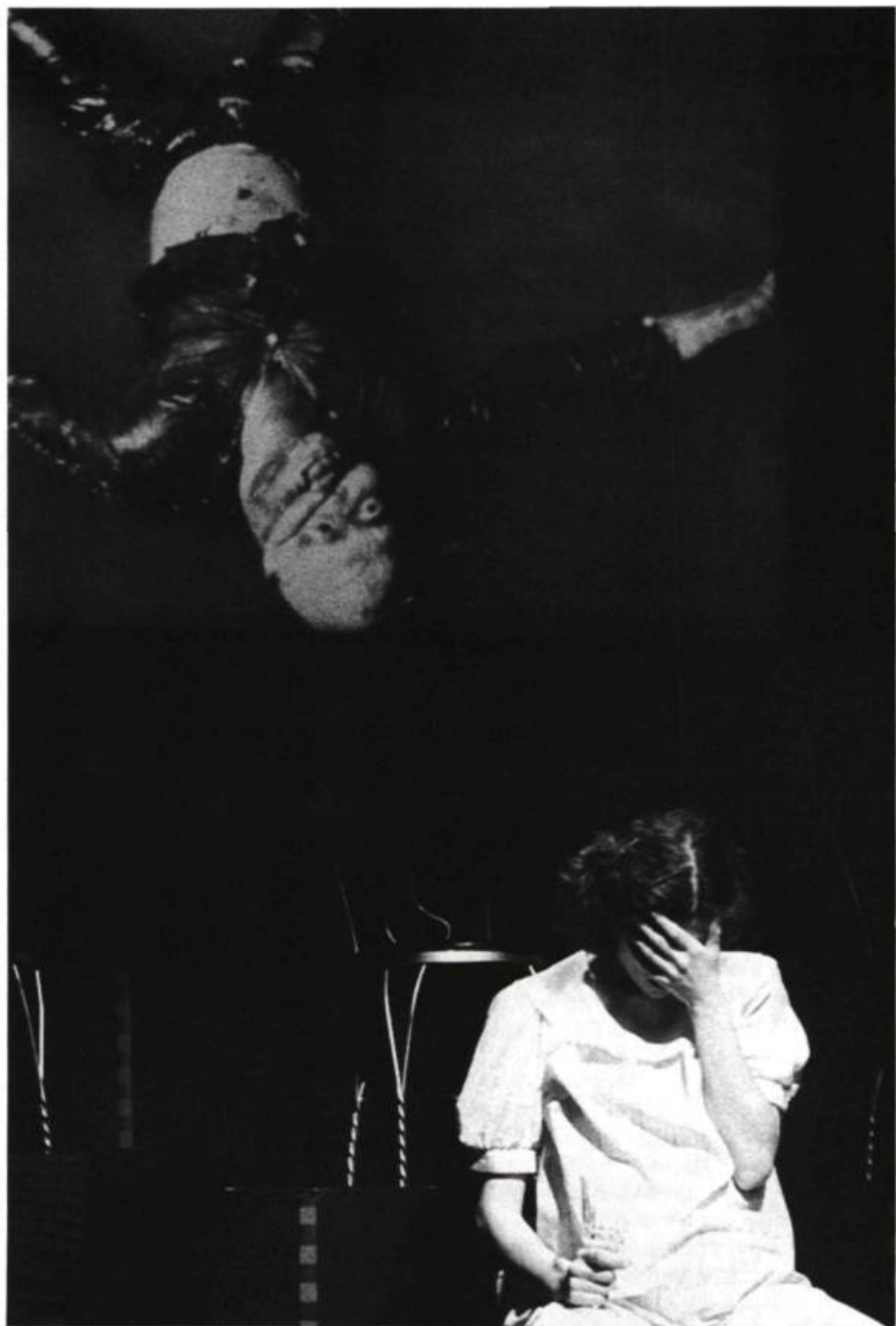
Nature morte , production du Théâtre de Quat'Sous. «La photo, dans la production, venait renforcer le texte. Comme les personnages ne bougeaient pas sur la scène, l'image projetée constituait un mouvement.»