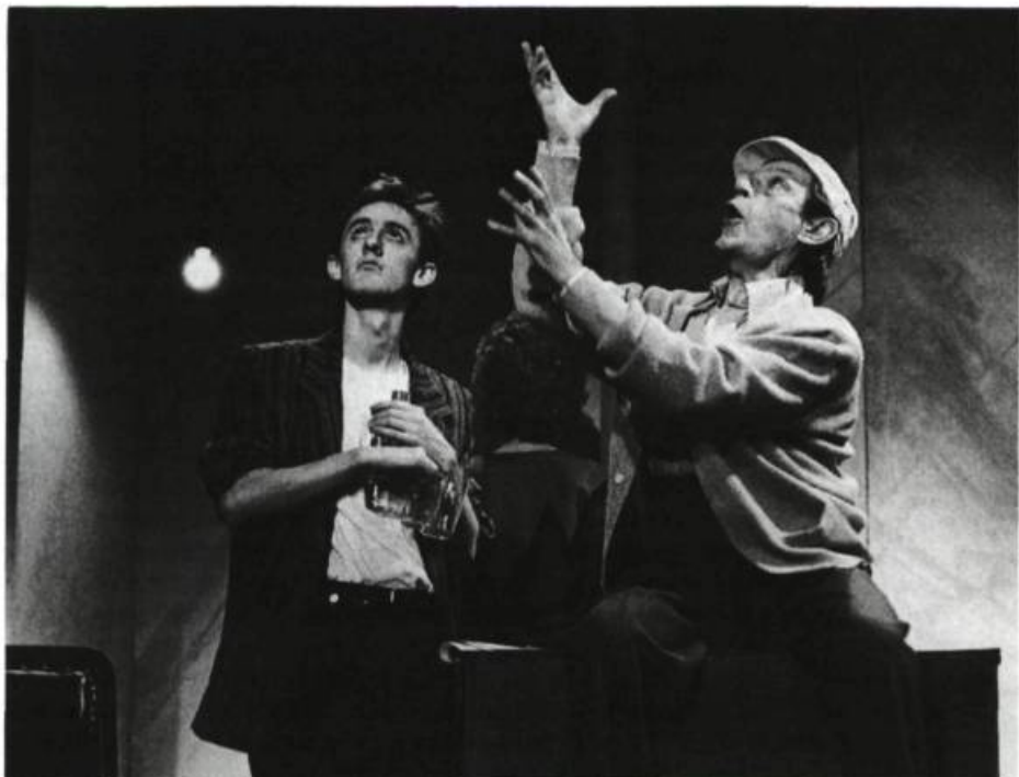
Défendu , spectacle du Théâtre Petit à Petit. La photo saisit l'action dans sa précision, reproduisant le geste et le regard dans leur élan.