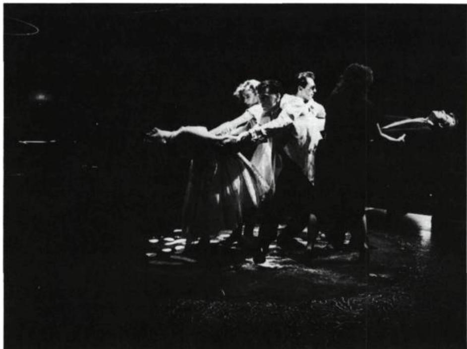
Passer la nuit.