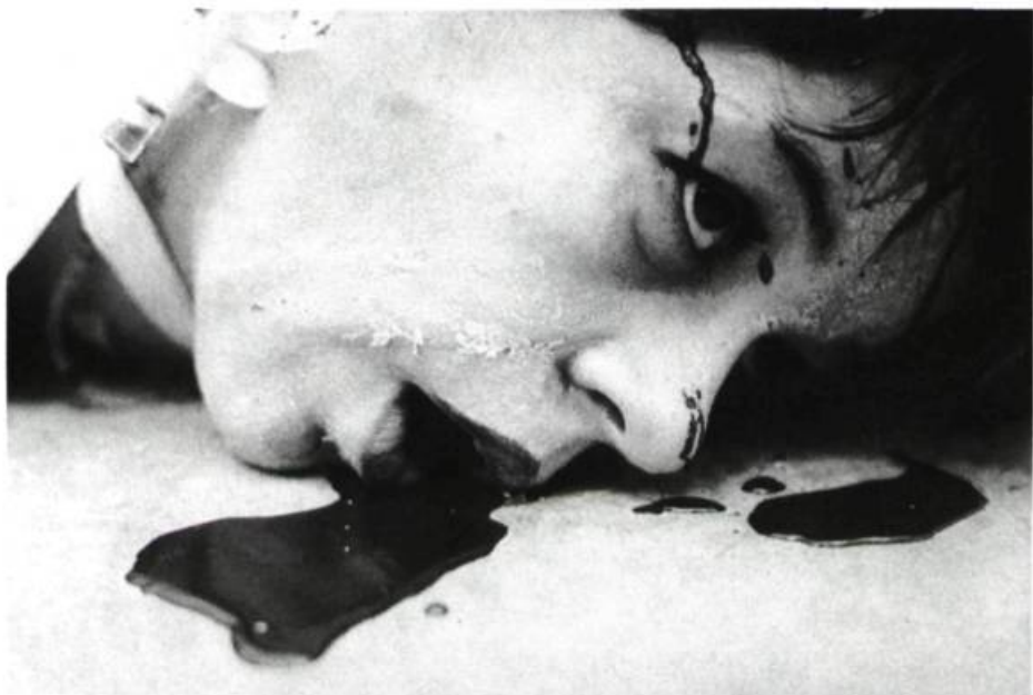
101, d'après 1984 de George Orwell. «Photographier non pas la mort mais quelqu'un en train de mourir.»

Elle résume bien l'un des deux aspects de mon travail de photographe de théâtre: