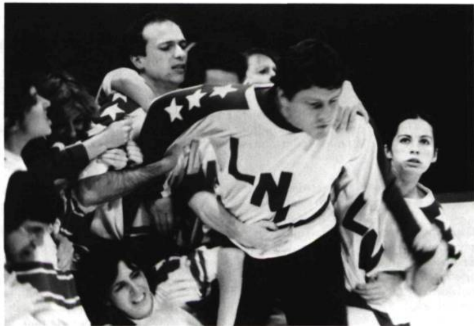
La L.N.I.: un jeu de société manichéen?

La liberté que l'on associe à l'improvisation est-elle illusoire?