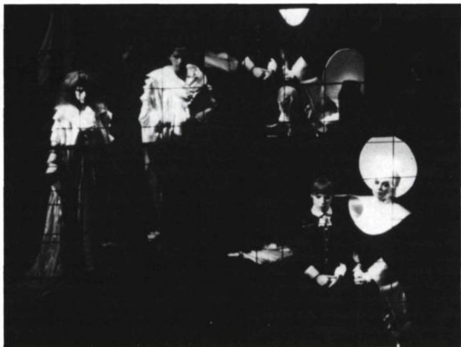
Fêtes d'automne, dans la production du Théâtre du Nouveau Monde.

L'autre faisait la moue. Mais ce faisant, elle était belle. Je sus en la voyant qu'elle s'appellerait Pamela. Il fallait envisager des trésors pour elle, des trésors que le commun des mortels ne pourrait pas voir. La folie avait passé par cette tête, dans la vie comme au théâtre, et j'entendais déjà qu'elle se pâme là, sur les planches, par devant et contre les feux de Métis, éblouissants que pour elle, nothing but lost love somewhere in a dreadful dream state . Alabama. Arizona. Alaskienne étendue d'une tête qu'un soleil irradie d'espairs mort-nés. Pamela n'aurait pour tout emblème que la glace mensongère du cristal, et elle serait apte à enlever la vie aux autres.