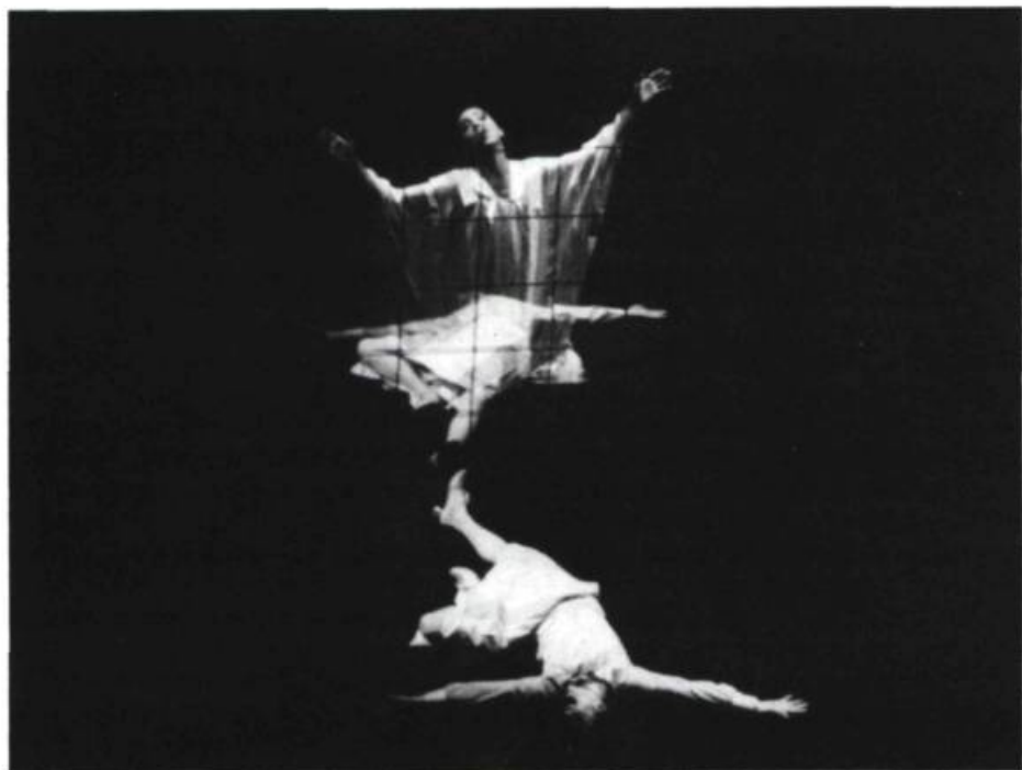
Quel reflet du miroir? Fêtes d'automne au T.N.M.

Un soir, il sera reçu chez moi, splendide, inouï, plus encore ce jour-là que jamais, que ce jour où l'idée des quatre portraits me vint après la nuit. Et comme c'est bien de perdre la tête! L'avoir saisi sur le vif, et lui dire: ce soir, tu restes. Ce soir, je t'emporte avec moi et je trompe l'écriture. Le magnifique! À lui tourner la page on le gratifie. C'était la dernière version de la Société de Métis . Au terme de toutes les additions, anciennes et nouvelles, éprises d'apocalypse où les dames aux grands chapeaux dansent dans les marais proches du manoir de Zoé Pé, Octave est l'histoire en son entier marquée de ses ténèbres concluantes candeurs, ne veut pour aucun rôle changer Octave d'un demi ton tant il est Octave, à jamais... (mais non, reste