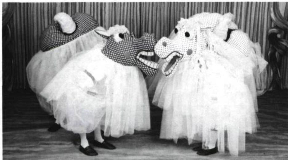
Une fantaisie géométrique, les chevaux de Gulliver (du Théâtre des Pissenlits).

Noiseux-Gurik. Qui se chargera de récolter ces trésors, avant qu'ils ne s'abîment dans la poussière des ateliers, la noirceur humide des greniers?