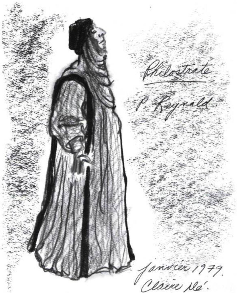
Le costume de théâtre naît sous forme de maquette: esquisse au crayon pour le Songe d'une nuit d'été , produit par le Théâtre Populaire du Québec.