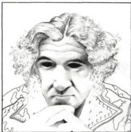
Augusto Boal