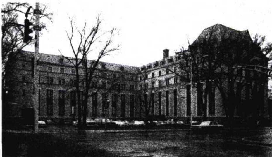
Les bureaux du ministère des Affaires culturelles, au 225, rue Grande-Allée est, Québec.

Dès qu'une proposition concernait l'État, dans le sens de subventionner plus et mieux, cela passait toujours très bien, contrairement à tout ce qui impliquait une définition du milieu dans sa pluralité. Prenons la question de l'unanimité, par exemple. Le milieu sait qu'il n'est plus unanime, mais ne sait pas encore comment accepter le pluralisme, c'est-à-dire les différences de générations, les différentes options politiques, artistiques, etc. Tout le monde court après une légitimité culturelle, mais les gens ne savent pas comment se définir les uns par rapport aux autres et ne veulent pas se définir les uns par rapport aux autres. C'est qu'au bout du