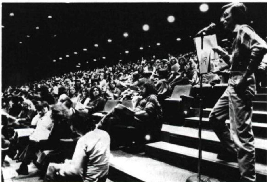
Plénière des États généraux du Théâtre professionnel, 9 novembre 1981.