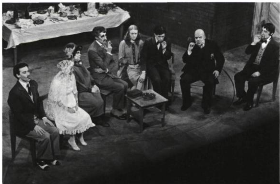
La Noce chez les petits bourgeois de Bertolt Brecht, à l'École Nationale de Théâtre, mai 1976. Mise en scène: Alain Knapp.

A.K. — Très simple: je propose des exercices dont les énoncés sont en général assez