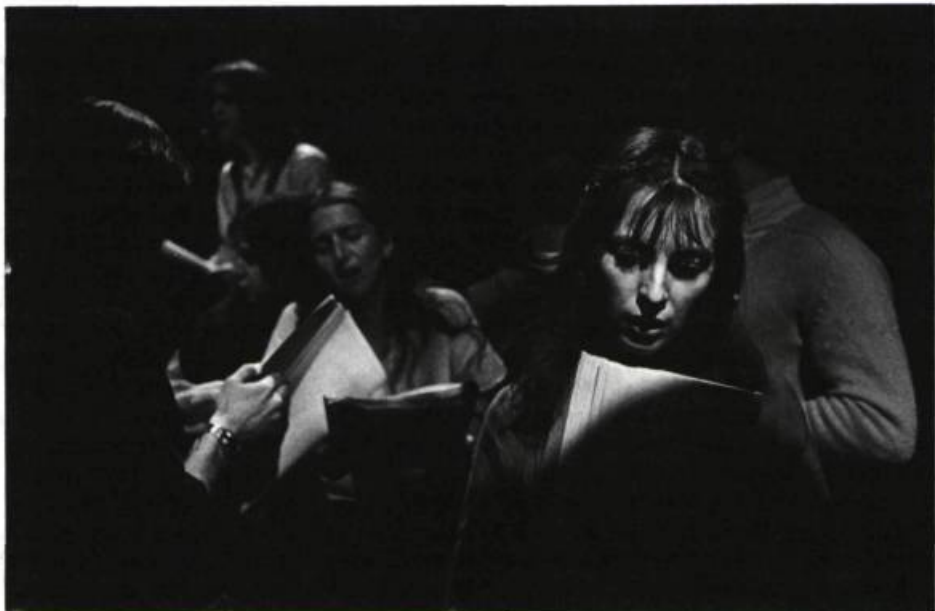
Où est-ce qu'elle est ma gang? de Louis-Dominique Lavigne. Lecture-spectacle du C.e.a.d..

essayer d'y survivre. La prison vue de l'intérieur. Théâtralisation (?) des rapports de pouvoir qui s'y vivent constamment, à tous les niveaux. Galerie de stéréotypes d'hommes — le «serin», le fou, la brute, la folle, le bon gars et le «stoole-baveux». La réhabilitation! Est-elle possible? Si oui, pour qui? comment en choisit-on les cobayes? Ne serait-elle pas employée uniquement pour sécuriser le système judiciaire lui-même? C'est définitivement une pièce dure et violente. Peut-on y échapper? La prison, «c'est l'inconscient d'une société», dit un des personnages. L'inconscient semble effrayer, le public était estomaqué. La rencontre après spectacle fut très brève, l'auteur ne voulant rien justifier: «Vous ne connaissez pas la Sibérie? Ce n'est maintenant plus vrai.» Il y avait spectacle ce soir-là. On ne parlait plus de vingt heures de répétition. Il se dégageait du plateau l'état de fébrilité des premières. L'enjeu? Trouver un producteur qui mène à terme son intention de présenter le spectacle.