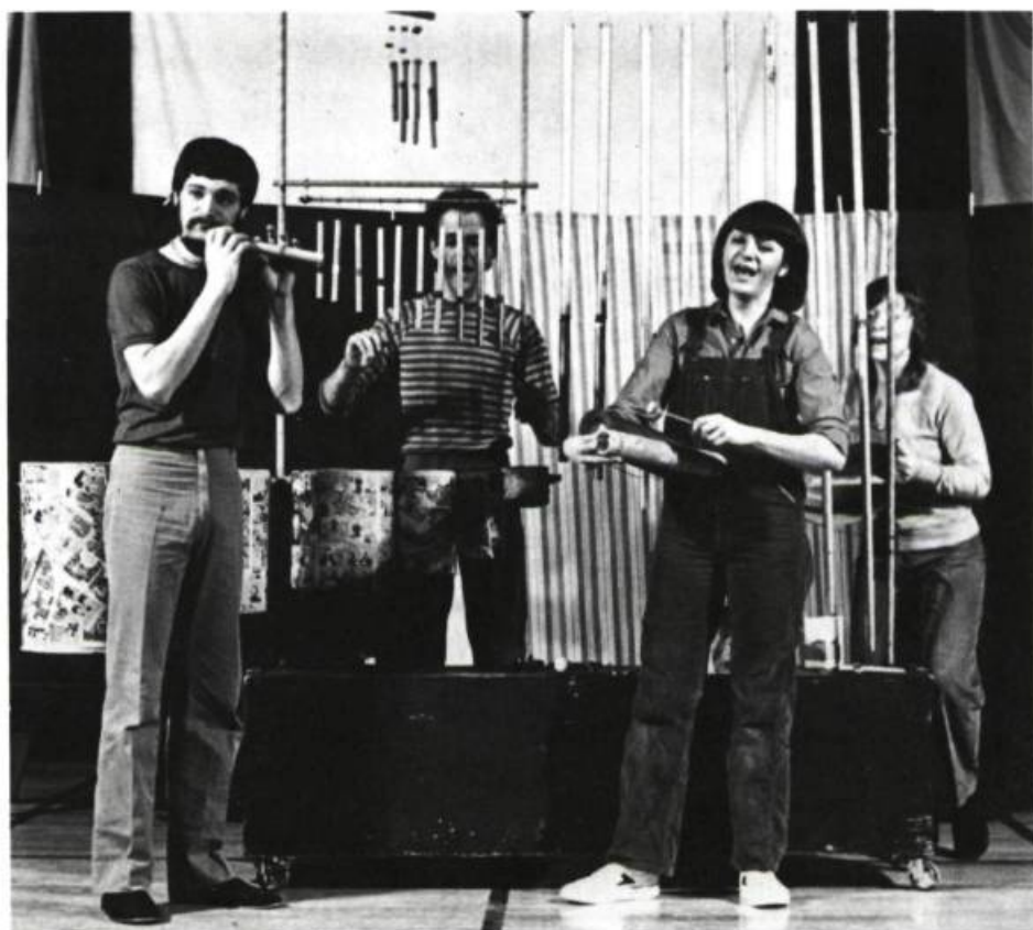
Prologue: entrée du chariot musical.