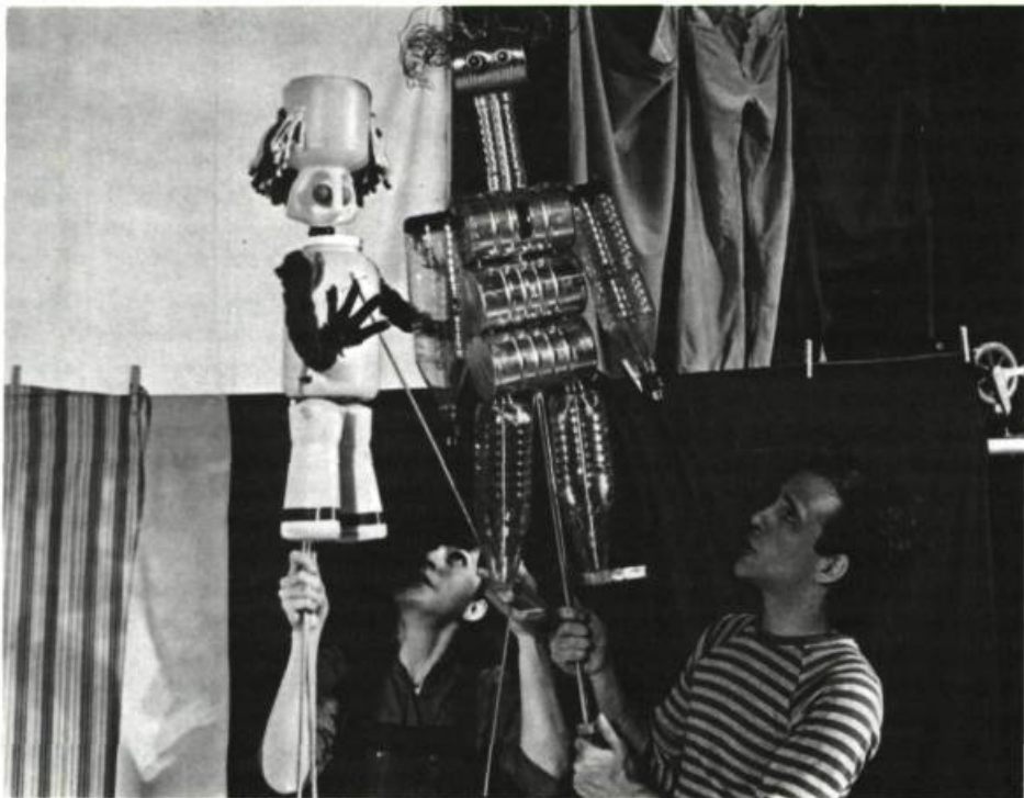
Marionnettes à tiges confectionnées à partir de différents contenants de plastique pour Regarde pour voir .

Quand ce n'est pas la mère de Jocelyn qui lui demande d'aller jouer dehors parce qu'il prend trop de place dans la maison, c'est la dormeuse qui trouve que les enfants font trop de bruit. Les personnages qui entourent les deux adolescents représentent bien le milieu. Ils font presque partie du décor, tant ils sont caricaturaux. La chanson qui constitue la première réplique aide à les définir. La mère fait son lavage «prise dans une cuisine/qui est grande comme la main» (p. 15). Le vieux M. Tremblay a de la difficulté à monter jusqu'au troisième et se plaint de n'avoir plus de place. La dormeuse travaille la nuit et n'a «pas de place pour dormir/pour avoir la paix» (p. 97). Le bibliothécaire s'ennuie dans sa bibliothèque déserte. Mais ce qui