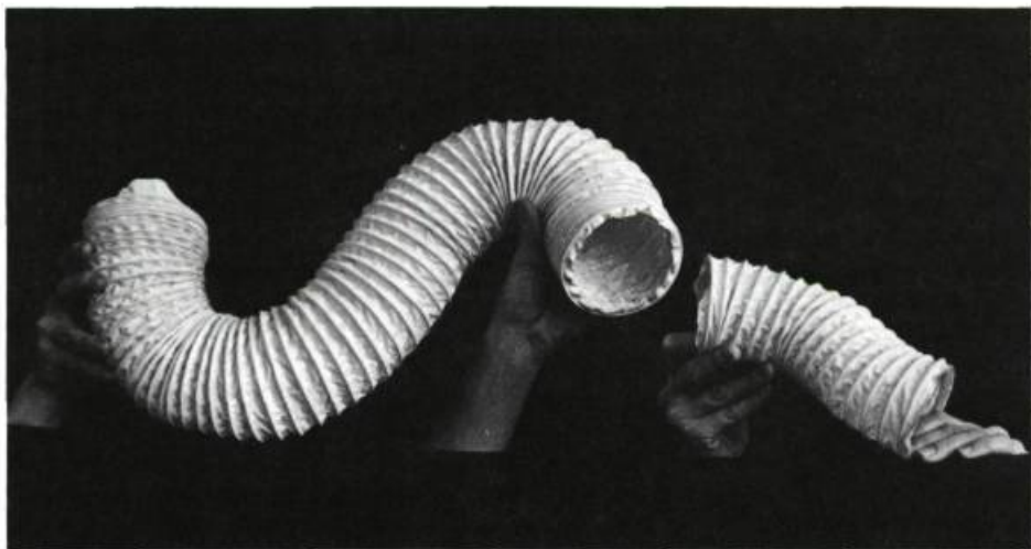
Par la manipulation, un objet usuel, familier prend vie.