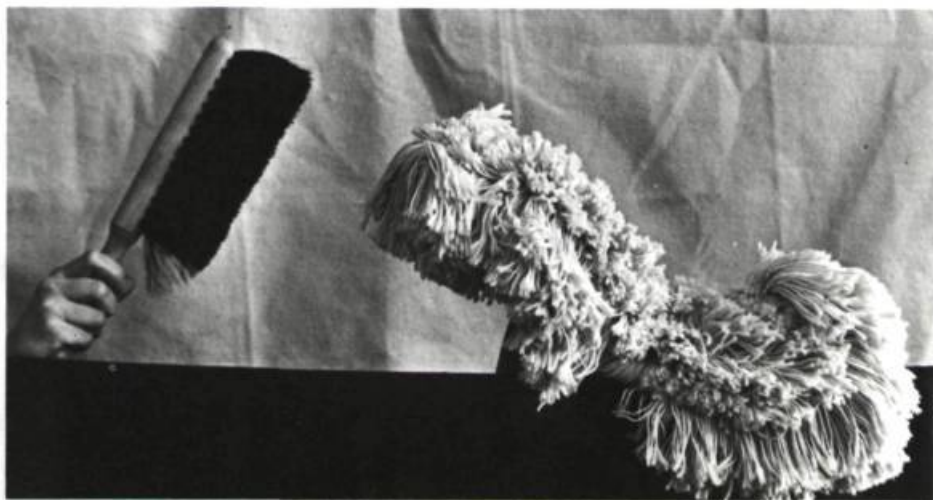
Vadrouille et brosse: des marionnettes inhabituelles. Photo: Théâtre de l'Oeil.

Regarde pour voir réussit non seulement à capter l'intérêt du spectateur par son contenu mais aussi par son rythme et ses couleurs. Le spectacle est d'abord ponctué par le déroulement des scènes: scènes de quartier entrecoupées de sketches de marionnettes. Il l'est aussi par le langage, langage de tous les jours, simple, direct, concret qui empêche toute longueur. Il l'est enfin et surtout par la musique. Présente tout au long de la pièce, plus rythme que mélodie, elle lie les scènes, accompagne et/ou décrit l'action. Il est à noter que les instruments, tout aussi intrigants que les marionnettes, ont eux aussi été fabriqués avec des matériaux de recyclage. Quant aux chansons, elles définissent les personnages ou expriment leurs pensées. Il est toutefois regrettable qu'elles ne soient pas plus mélodieuses. Peut-être ne s'accordent-elles tout simplement pas avec le registre des comédiens... D'une façon ou d'une autre, peu de spectateurs pourraient en fredonner l'air. C'est dommage, car il s'agit du seul élément non accrocheur du spectacle. Le décor est tout autre. Les tons neutres des draps épinglés sur la corde à linge font ressortir les tons brillants des costumes des comédiens principaux. Ils permettent également de placer l'accent sur les toiles de fond des sketches, composées d'appliqués de tissus aux couleurs vives. Quant aux marionnettes, leurs couleurs et leurs formes éblouissent.