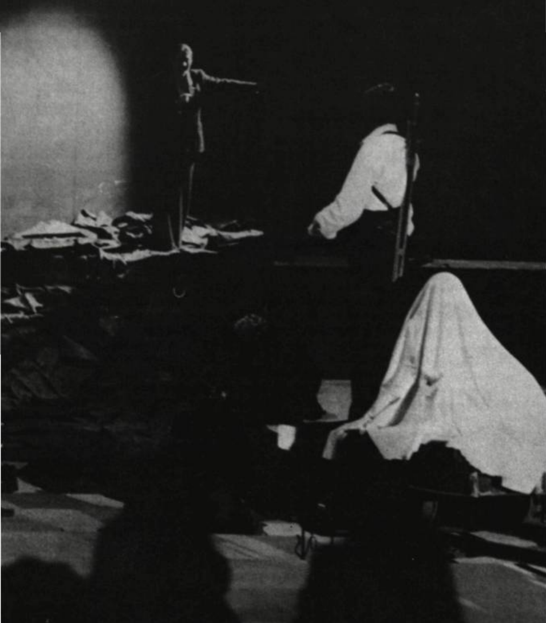
Die Orestie des Aischylos (L'Orestie) . Mise en scène de Peter Stein, Berlin, 1980.