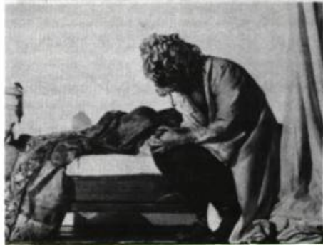
Othello de Shakespeare. Mise en scène de Peter Zadek, 1976. Le meurtre de Desdémone.