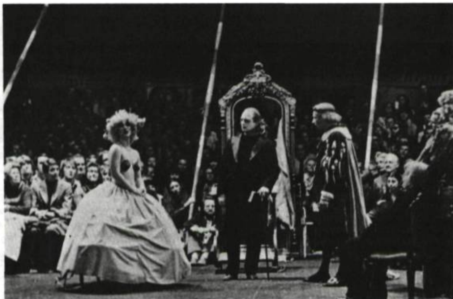
Hamlet de Shakespeare. Mise en scène de Peter Zadek au Cirque de Munich.