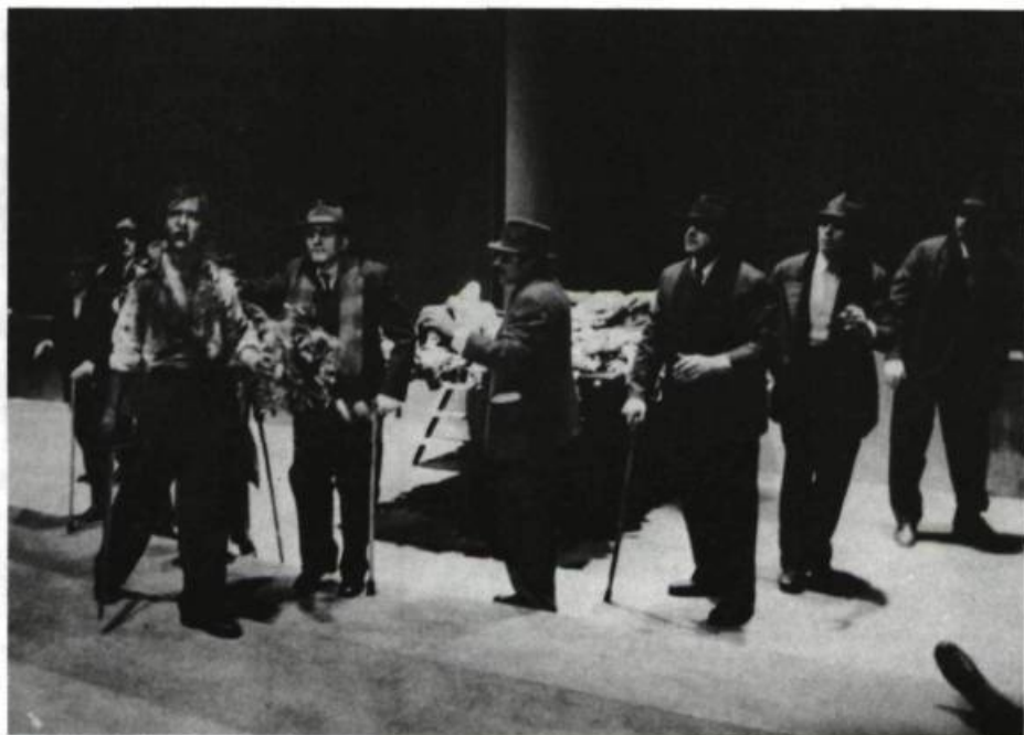
Die Orestie des Aischylos (L'Orestie). Mise en scène de Peter Stein, Berlin, 1980.

pris soin d'éviter tout modernisme en juxtaposant chaque mot à sa traduction littérale» 4 . Il a même poussé le scrupule jusqu'à réinstaurer, dans une salle de théâtre vidée de tous ses sièges et de toute super-structure scénique, l'architecture d'un amphithéâtre grec: le dispositif scénique de l' Orestie reproduit exactement celui-ci, avec l'«orchestra» en avancée parmi les spectateurs, la «skènè» en retrait et légèrement surélevée, et le portique devenu une haute muraille percée de deux portes, l'une centrale, monumentale, dont les deux battants ne s'ouvrent que pour laisser passer des cadavres, ruisselants de sang, et l'autre, latérale, de petites dimensions.