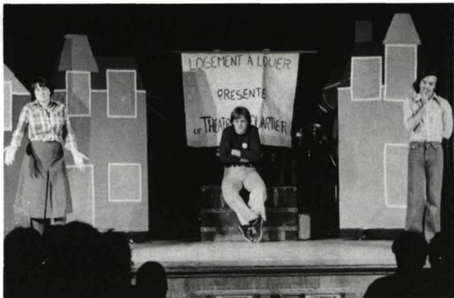
Logement à louer. Théâtre de Quartier, 1978.