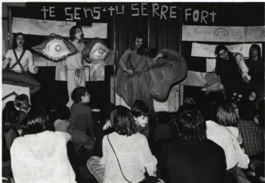
Te sens-tu serré fort? Théâtre de Carton, 1978.