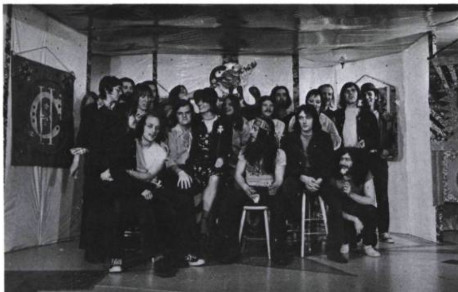
Fondation de la Coopérative du Grand Cirque Ordinaire.