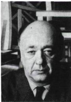
Eugène Ionesco.