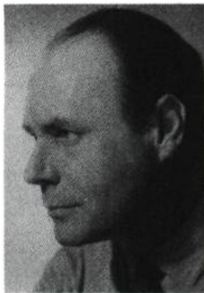
René de Obaldia.