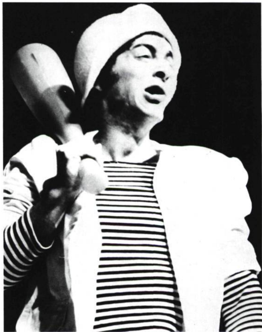
Monsieur "T" a plus d'un tour dans son sac , spectacle du Tiers-Théâtre, novembre 1973. Joyeuse caricature du théâtre traditionnel, sur un mode clownesque.

En partie contesté au collège, l'auteur dramatique le sera davantage quand ces étudiants d'hier se retrouveront dans ce qu'on peut appeler par opposition au théâtre de collège, le théâtre de société. La contestation prend alors une allure plus "sérieuse", car les jeunes ont continué de s'affranchir des auteurs et parviennent désormais à s'en moquer.