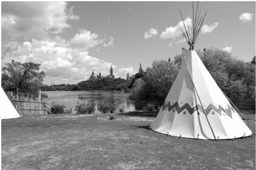
Figure 2: Wigwam at the Aboriginal Experiences village, Turtle Island Tourism Company, Victoria Island, Ottawa. Photo by the author, August 2013.

Local historical knowledge is all around us. It is inscribed in our memories of people, places, and shared experiences. It is integral to our identity as members of communities with a common history. It strengthens connections between people, past and present, and it better positions us to face the future. As long as we live in communities, local historical knowledge will continue to be generated as we interact with one another and adapt to our environments. As historians we have barely scratched the surface of the possibilities for documenting and interpreting local historical experience. The field is