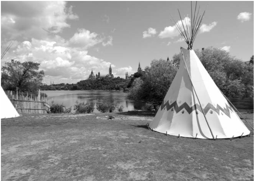
Figure 2 : Wigwam sur le site d'Aboriginal Experiences Village. Turtle Island Tourism Company, île Victoria, Ottawa. Photo de l'auteur, Août 2013.

Nous baignons dans la connaissance locale du passé, qui est gravée dans notre mémoire des gens, des endroits et de nos expériences communes. La connaissance locale du passé est la pierre de touche de notre identité à titre de membres de collectivités qui ont une histoire commune. Elle resserre les relations entre les gens et le passé et le présent, et elle nous arme pour l'avenir. Tant que nous vivons dans des collectivités, la connaissance locale du passé continuera d'être générée dès lors que nous entrons en contact les uns avec les autres et que