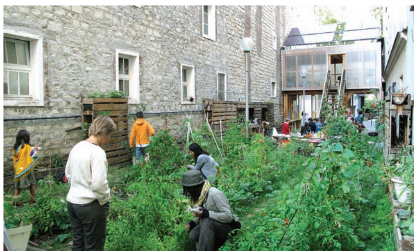
Le Passage 56, jardin partagé, 2009.

L'agencement jardinier nous apprend à traverser les milieux, à passer d'un espace à un autre, à changer d'emplacement et à y revenir. Petit à petit, nous avons pu relier les espaces hétérogènes que nous construisions ensemble avec leurs usagers, en occasionnant des rencontres inhabituelles, des bribes de dialogue, du faire ensemble, des contradictions en douceur : un apprentissage du politique par des temporalités, des dynamiques et des contenus hétérogènes. Plutôt que des formes verbales et délibératives, l'agencement jardinier encourage des pratiques physiques, gestuelles, visuelles, non verbales, et une démocratie incorporée : un vivre ensemble comme corps commun 18 .