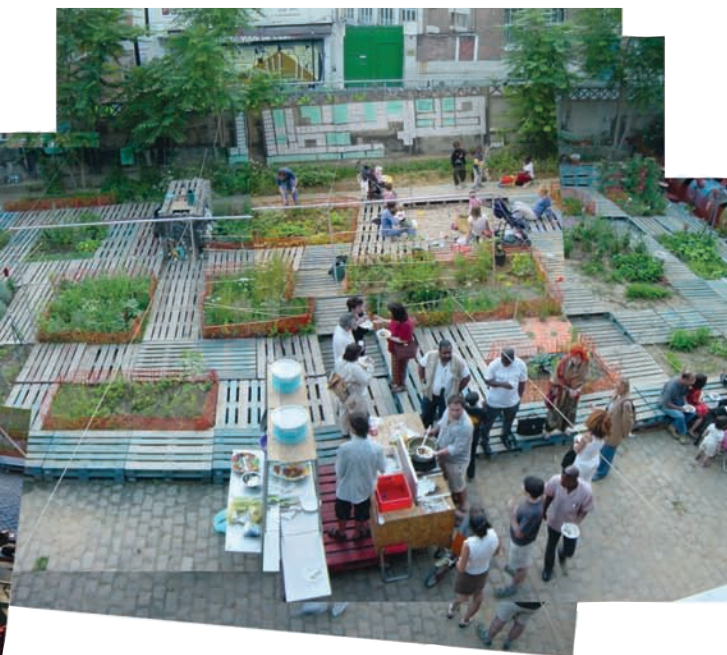
ECObox, Paris 18 e , quartier La Chapelle, site de la Halle Pajol, 2001-2005.