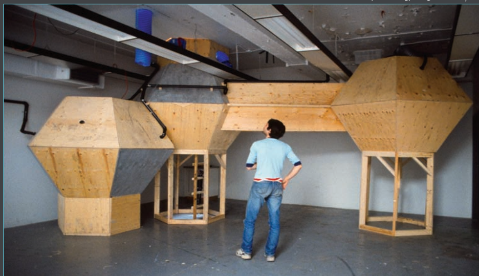
> Skylight Module Complexe, 2000 .