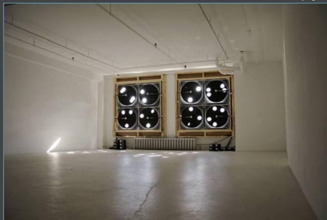
> We're Looking for You, Galerie B-312, 2006 .