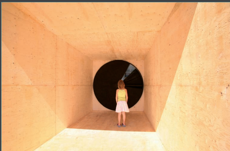
> Shutter, Cafka 05, 2005 .