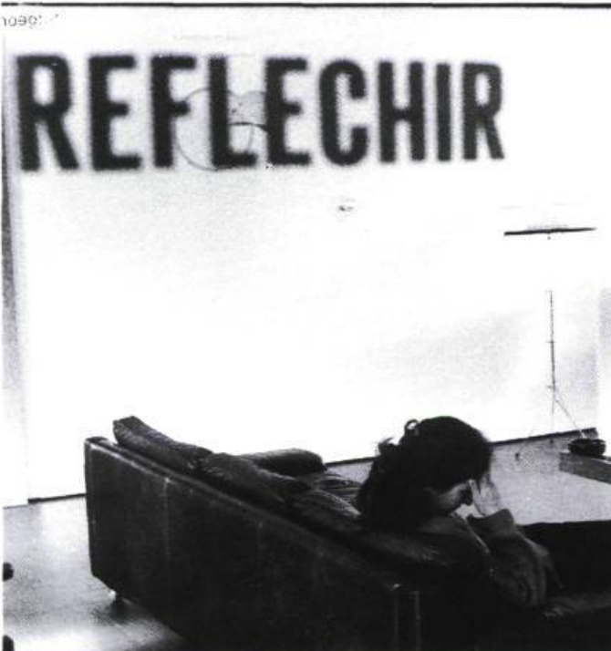
Haut : Ian SWIDZINSKI, Espace contextuel, Varsovie, Pologne ; centre : Espace P.R.I.M., Montréal, Québec ; bas : Espace Danae, Pouilly, France