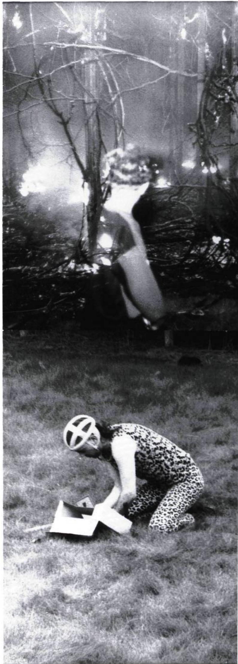
Haut : Espace Frigo, Lyon, France ; bas : Espace Raum F, Zurich, Suisse