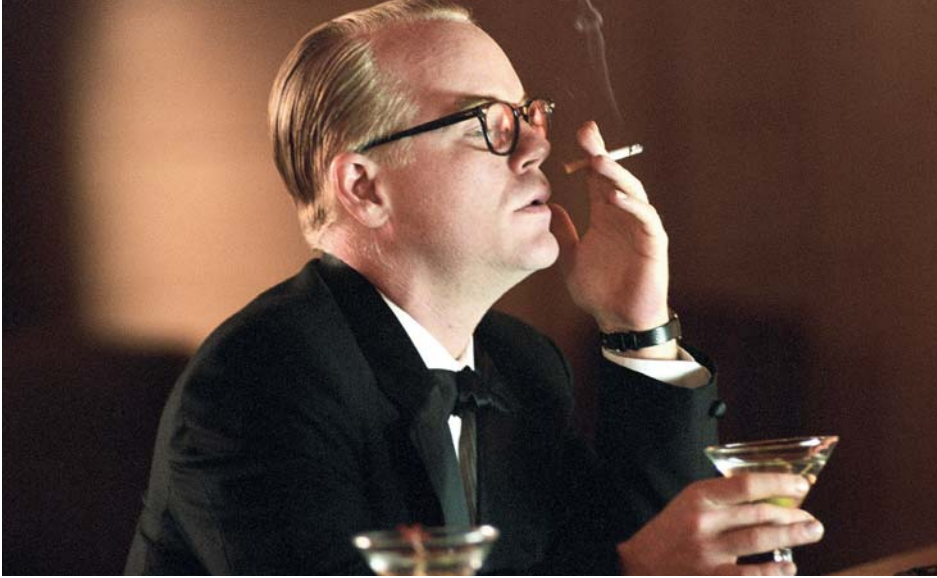
↑ Capote de Bennet Miller (2005)