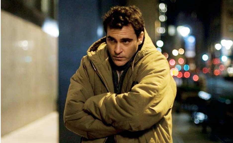
↑ Two Lovers de James Gray (2008)