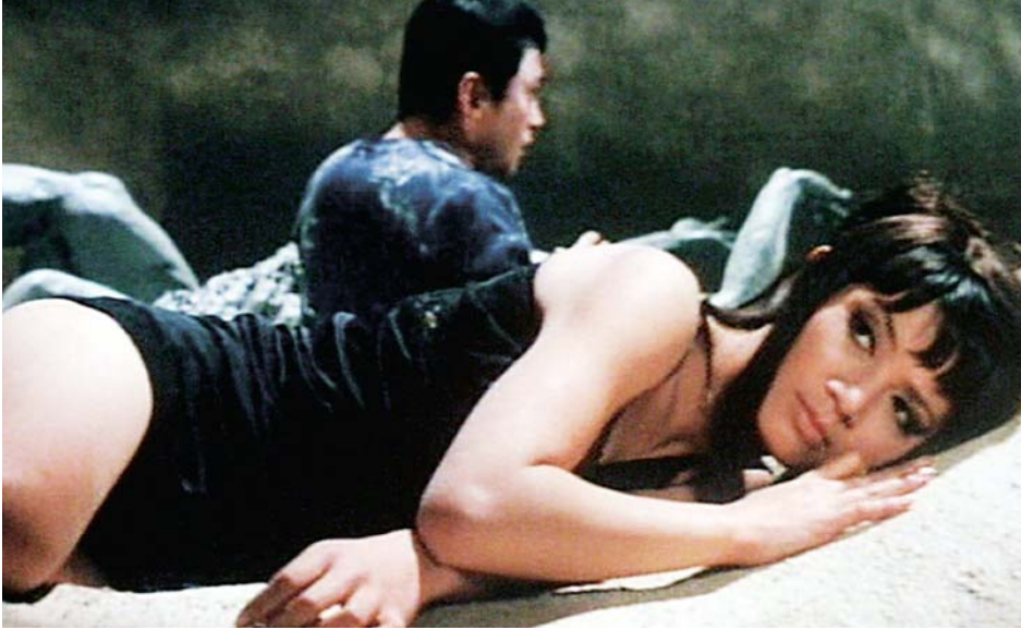
↑ Moju: the Blind Beast de Masaru Konuma (1969)