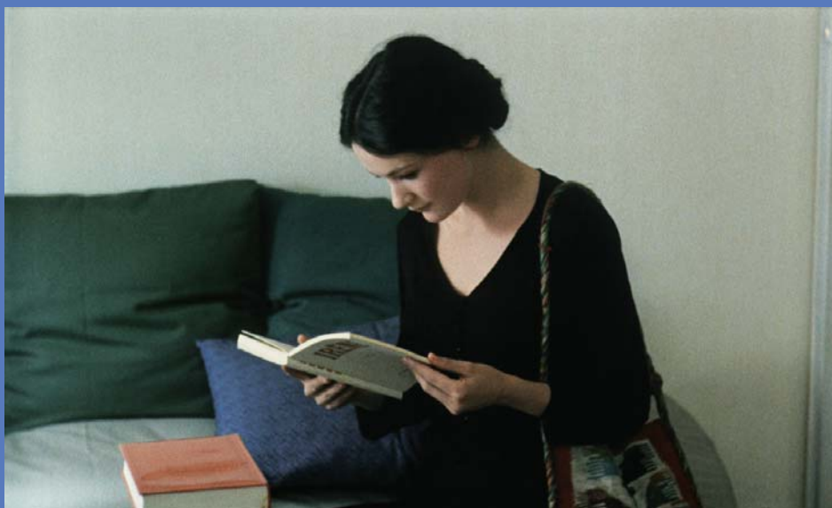
↑ Quatre nuits d'un rêveur de Robert Bresson (1971)

Depuis Georges Méliès et son Voyage dans la Lune (1902) inspiré de Jules Verne, l'histoire commune de la littérature et du cinéma est jalonnée d'œuvres personnelles, audacieuses et surprenantes qui témoignent des liens fusionnels entre ces deux formes artistiques. Aussi nous semblait-il laborieux, voire superflu, de prétendre à une quelconque exhaustivité dans l'index qui clôt, de manière désormais traditionnelle, notre dossier spécial.