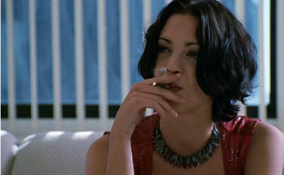
↑ New Rose Hotel d'Abel Ferrara (1998)