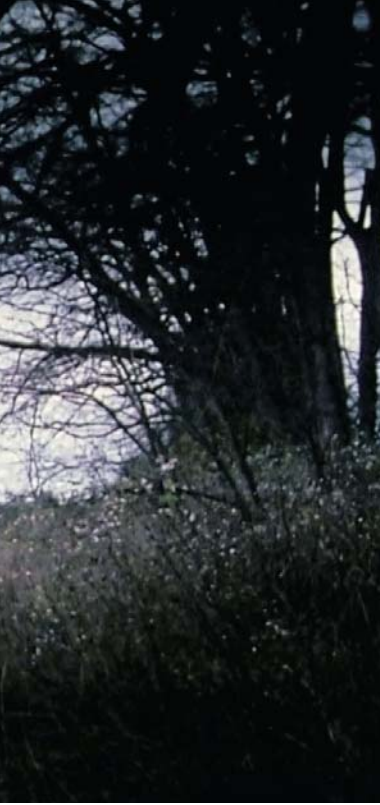
↑ The Resurrected de Dan O'Bannon (1992)

véritablement d'une érosion de la raison. Cet humour macabre, qui était déjà bien présent dans la nouvelle de 1922, articule d'une tout autre manière les grandes thématiques lovecraftiennes, à commencer par cette horrible absurdité, qui découle ici du non-sens d'un corps réduit au simple état de viande articulée. From Beyond poursuit dans cette veine criarde et excessive, comme si Gordon concevait chaque mention d'une chose « indescriptible » dans le texte original comme un défi à relever. Les effets spéciaux deviennent ici les engrenages d'une spirale infernale, qui dégénère au fur et à mesure que s'effritent les repères de la logique et de la morale.