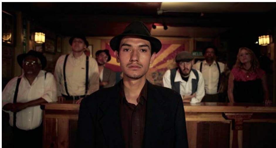
↑ Bisbee '17 (2018) → → Actress (2014)