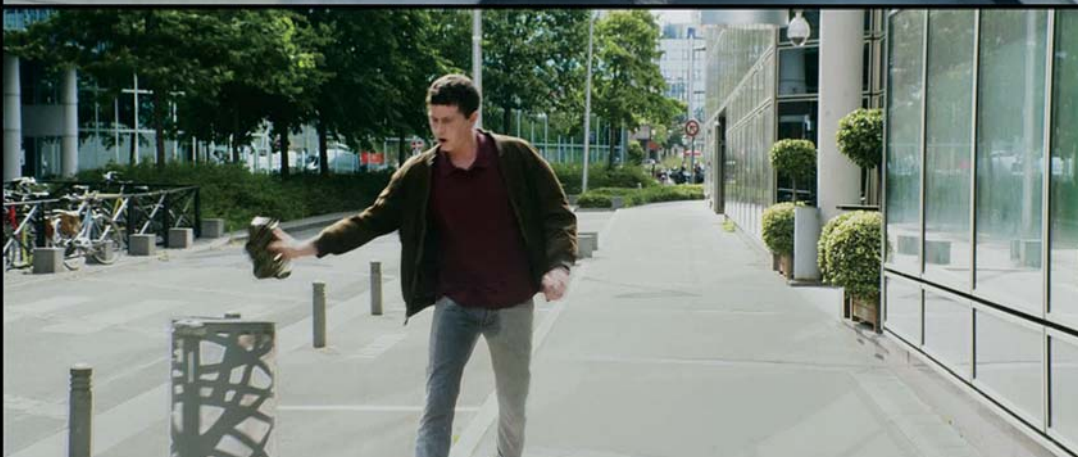
↑ Nocturama (2016)