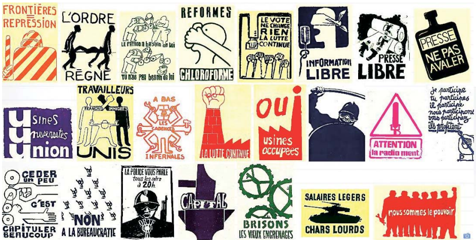
↑ Affiches de Mai 68 – Anti-K ↑ Affiche du film collectif Loin du Vietnam ↑ Couverture Le cinéma s'insurge n° 1 – États généraux du cinéma – Eric Losfeld éditeur – Le Terrain Vague 1968