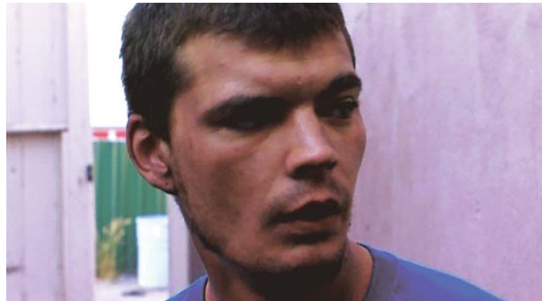
An Injury To One (2002) et Who Killed Cock Robin? (2017)

cause d'un meurtre ! Et donc d'une famille détruite à jamais ! De sorte que ce meurtre est un événement contemporain. Il façonne la réalité de cette famille aujourd'hui, comme la mienne puisque j'en parle.