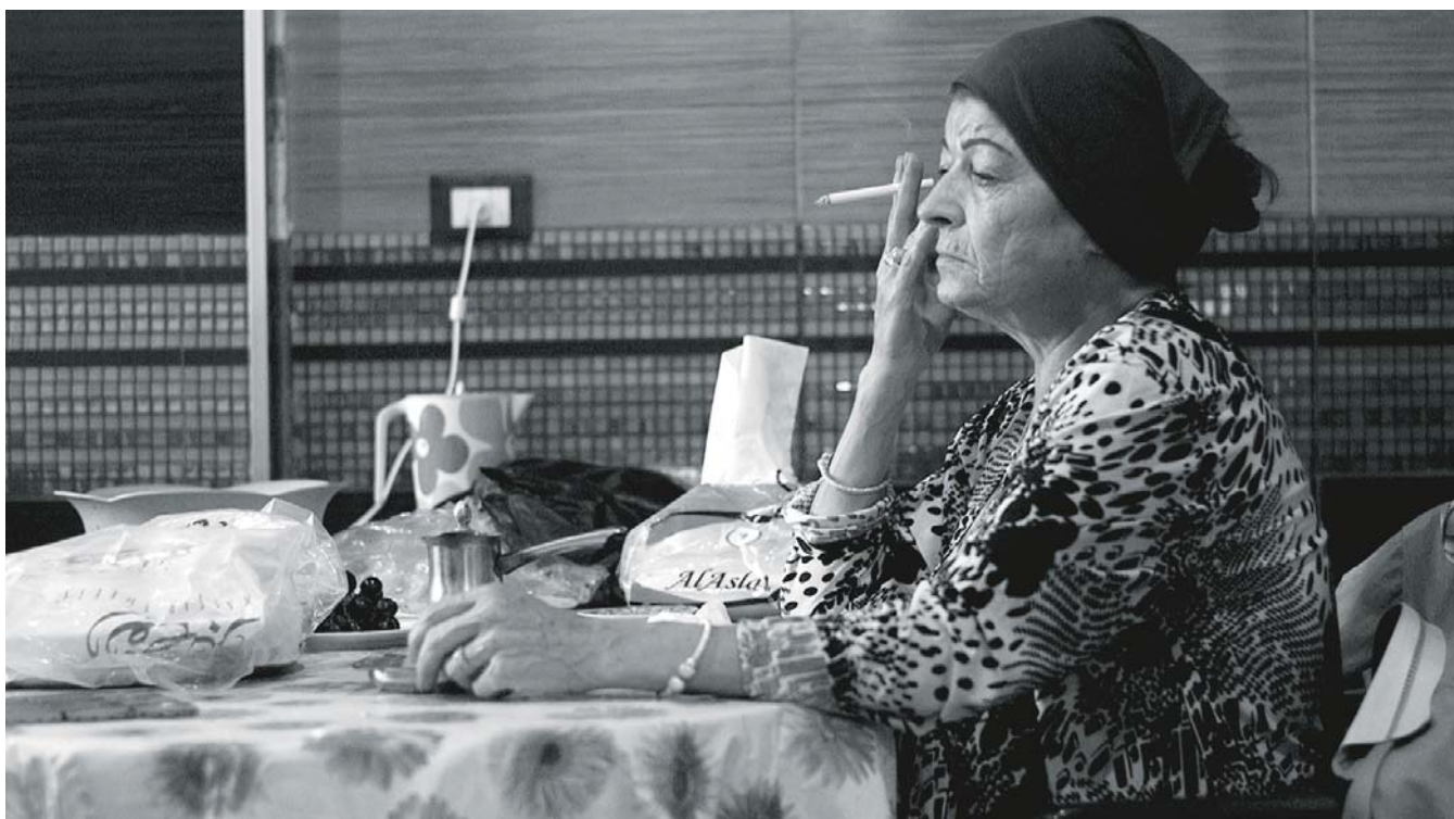
Did You Wonder Who Fired the Gun? (2017)

horribles. Je ne veux pas juste déprimer le spectateur, je veux aussi le questionner et le défier.