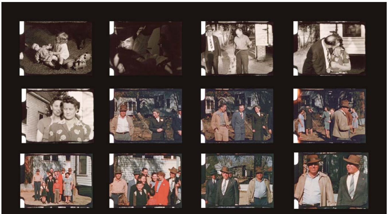
Did You Wonder Who Fired the Gun? (2017)