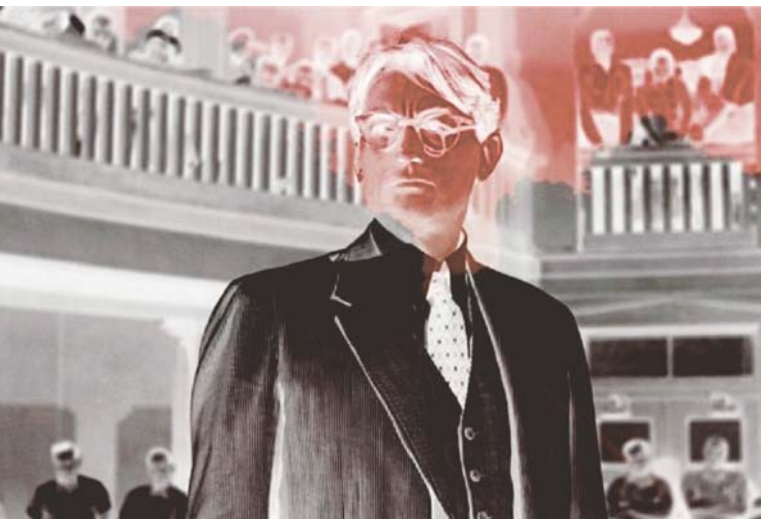
Did You Wonder Who Fired the Gun? (2017)

C'est exact. Je connais une enfant qui n'arrive pas à faire la différence entre demain et hier. Il lui arrive fréquemment de dire des choses comme : « J'ai joué avec mon ami demain ». En la corrigant, je me suis mis à penser aux scientifiques qui affirment que cette notion voulant que le temps soit linéaire est une abstraction. Il n'y a réellement que le présent. Nos concepts du futur et du passé sont entièrement construits. Et cet enfant exprime cela constamment.