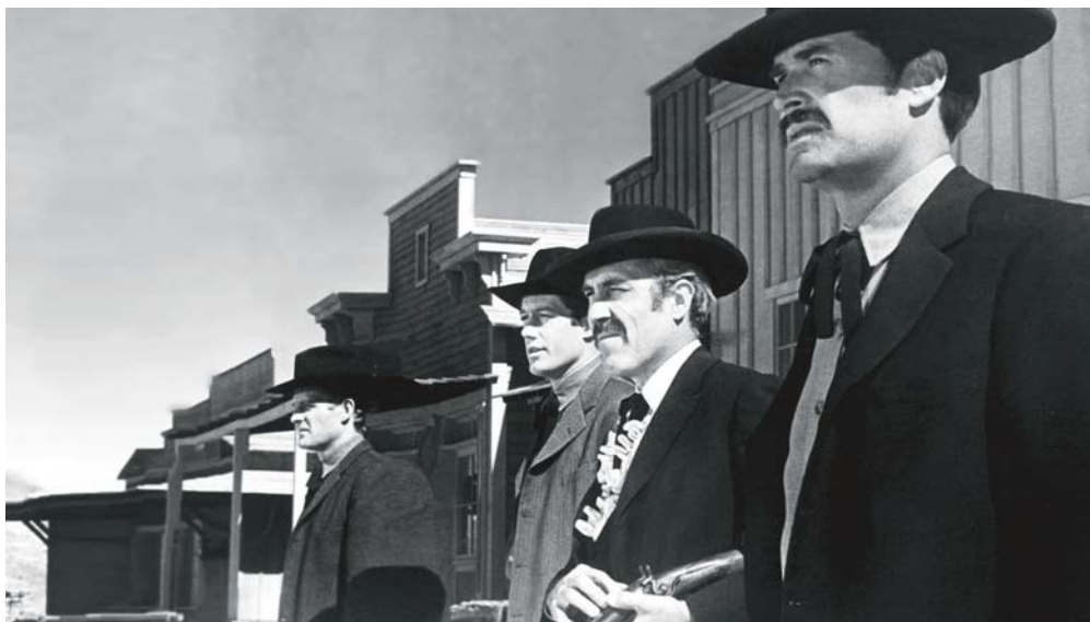
Hour of the Gun de John Sturges (1967)

Qui ne connaît pas l'histoire de Wyatt Earp et de Doc Holliday ? Enfin, à peu près, car nous la connaissons surtout par le cinéma, et les nombreux films l'ayant mise en scène sont autant de variantes d'une histoire réelle, dont le point culminant narratif est le règlement de comptes à O.K. Corral. Le fil conducteur de cette histoire est une amitié surprenante entre un marshal droit dans ses bottes et un hors-la-loi alcoolique et tuberculeux. Dans les reprises successives de ce schéma, la nature de leurs rôles respectifs va parfois changer, témoignant de ce qui fait la force même du Western : peu importe que l'on reprenne sans cesse la même histoire (ce qui de toute façon est inévitable après deux mille ans de récits derrière nous, comme le dit si justement Walter Hill), du moment que celle-ci résonne, quelque part, avec son époque.