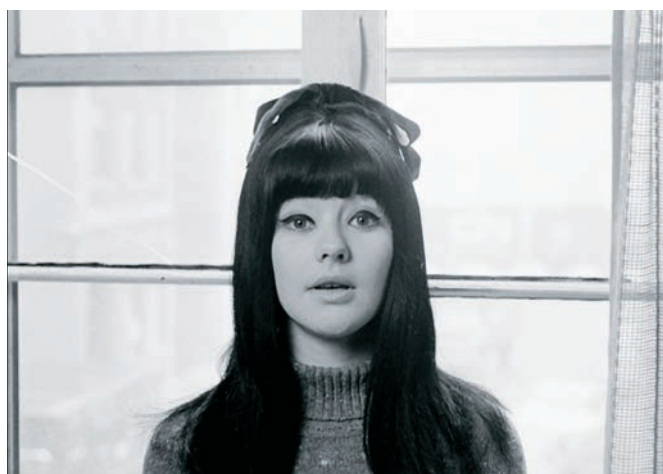
All You Can Eat Bouddha de Ian Lagarde et La part du diable de Luc Bourdon