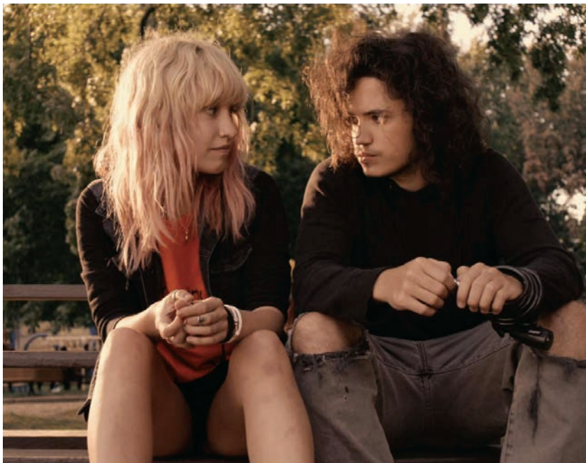
Les faux tatouages de Pascal Plante

Les tribulations de Claire en apprenti artiste comme en apprenti adulte nous renvoient automatiquement à la grande époque de l'art vidéo à Montréal, plus précisément aux années 1990, celle de Sylvie Laliberté (ou de Miranda July dans les années 2000 chez nos voisins du Sud). Jouant le rôle-titre, la jeune cinéaste se filme sous toutes