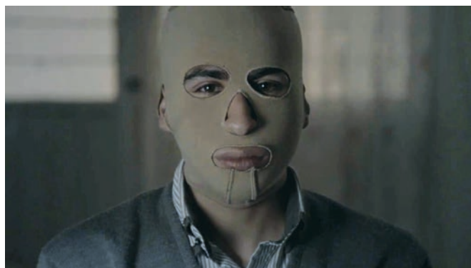
Devil's Freedom (La Libertad del Diablo) de Everardo González

P our son troisième film, Everardo González a adopté un dispositif simple : questionner les victimes de la violence au Mexique et ceux qui l'ont commise en les masquant par des cagoules couleur chair. Plus que tout discours sur les kidnappings, tortures et meurtres, les témoignages vont au-delà des affects qu'ils peuvent provoquer (réprobation, haut-le-cœur...), le masque permettant de ne s'attacher qu'aux paroles, terrifiantes, qui, des deux côtés des protagonistes, finissent par se ressembler, parfois mot pour mot. Ainsi, la caméra interroge le potentiel d'abjection en chacun de nous. Aucune catharsis en vue, ni aucune rédemption ici, que l'exposition d'une froide barbarie que des plans de coupe de paysages n'oblitéreront pas. Un constat funeste et fort.