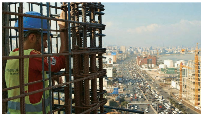
Taste of Cement de Ziad Kalthoum

C omment trouver le langage cinématographique pour traduire l'horreur de la destruction d'un pays, le désespoir de l'exil, le cauchemar de l'enfermement ? Avec une ambition formelle rare parmi les nombreux documentaires sur le conflit syrien, Ziad Kalthoum lève le voile sur une situation qu'il a lui-même vécue : celle des réfugiés syriens devenus travailleurs du bâtiment au Liban, construisant de jour un pays sorti de la guerre tandis que le leur s'y enfonce toujours plus, confinés de nuit sur le chantier par un couvre-feu inhumain. Vertige audiovisuel inoubliable, Taste of Cement pose la question du sens qu'on peut donner à la vie quand la possibilité du retour n'existe plus.