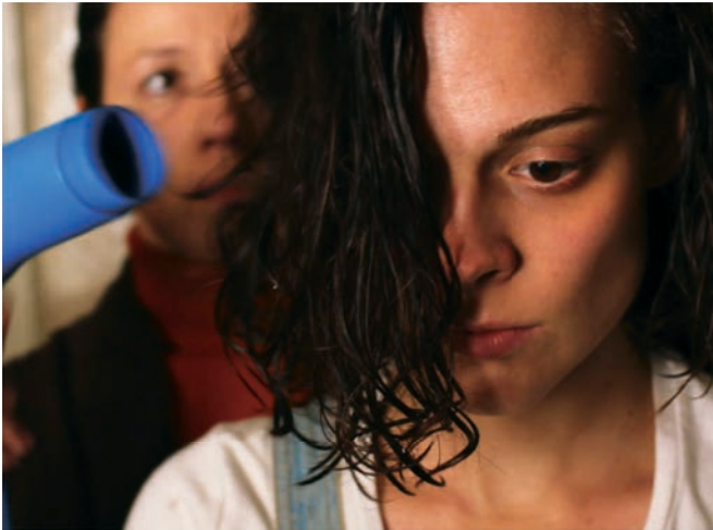
Tesnota/Closeness de Kantemir Balagov

R etenons ce nom. Ce nouveau venu (il a 25 ans, c'est son premier long métrage) réussit un film impressionnant sur un sujet incroyablement délicat. Élève de l'école de Sokourov, citant Mouchette de Bresson et Rosetta des frères Dardenne parmi ses films préférés, il a déjà une esthétique bien à lui. Aux marches de l'empire (russe), dans le Nord-Caucase, un mariage dans la communauté juive. Au milieu des années 1990, un fait divers : les mariés sont enlevés contre rançon. L'héroïne est la sœur du marié, amante d'un jeune kabarde (une communauté convertie à l'Islam). Tension dans et entre les communautés : un Roméo et Juliette sale, incroyablement claustrophobe, notamment grâce à une caméra qui emprisonne ses sujets. Irrespirable et donc essentiel.