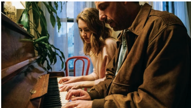
The Meyerowitz Stories (New and Selected) de Noah Baumbach

R appelant The Squid and the Whale (2005) et Margot at the Wedding (2007), ce énième portrait à la fois drôle et amer d'une famille déchirée confirme l'experte aisance avec laquelle Noah Baumbach sait dépeindre les relations humaines dans tout ce qu'elles ont de complexe et de contradictoire, de cruel et d'affectueux, de sincère et d'hypocrite. Mais, comme l'indique ce titre aux consonances littéraires assumées, The Meyerowitz Stories ne se contente pas d'une seule histoire ; il multiplie les récits, les souvenirs et les anecdotes, tout comme les points de vue qui s'entrecroisent ici pour tisser une courteline venant rendre justice aux drames et aux défauts de chacun de ses personnages.