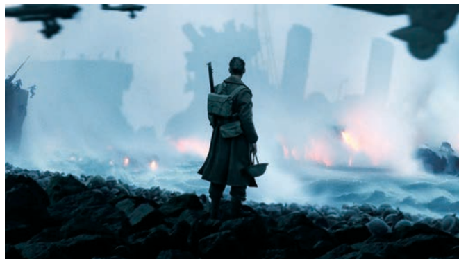
Dunkirk de Christopher Nolan