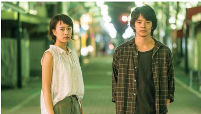
The Tokyo Sky is Always the Densest Shade of Blue de Yûya Ishii

Il y a ces métropoles foisonnantes où il est à la fois agréable et terrible de vivre et puis il y a Tokyo : métropole des métropoles, ville des villes, et lieu de toutes les rencontres. Quiconque ayant déjà foulé son sol sera immédiatement frappé par la fulgurance et l'authenticité de The Tokyo Night Sky Is Always the Densest Shade of Blue , 12 e long métrage de Yuya Ishii (The Great Passage), inspiré d'un recueil de poésie de Tahï Saihate. Formellement, le cinéaste de 34 ans livre ici son film le plus brave et exalté : une chronique, à la fois poétique, romantique et nonchalante de la rencontre entre deux âmes solitaires – Shinji et Mika – tentant désespérément de joindre les deux bouts, à la lisière de la vie adulte. Portrait émouvant et sincère d'une jeunesse désœuvrée, bien que très occupée ; croulant sous les factures, alors qu'elle ne demande qu'à vivre, aimer et souffler un peu, face au vertige de la cité.