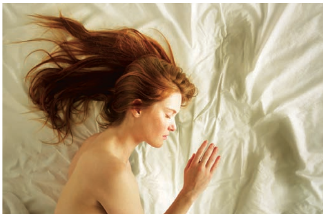
Mon ange de Harry Cleven

M on ange est un film inattendu, qui touche droit au cœur alors même que l'on se demande quel objet étrange on est en train de regarder. C'est l'histoire d'un enfant invisible, élevé par une mère qui le cache au monde; un jour, il rencontre une petite fille aveugle. Ils vont grandir, leur amour aussi... Derrière cette intrigue aussi candide que risquée se cache une prouesse de cinéma, portée par des images somptueuses et une atmosphère troublante. Avec ses effets spéciaux non numériques, sa poésie sans bornes et sa sensualité poussée à l'extrême, Mon ange renoue avec l'essence même du cinéma et parvient à transposer à l'écran l'intimité amoureuse avec une grâce magique et décomplexée.