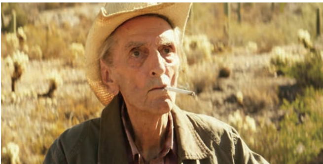
Lucky de John Carroll Lynch

C igarette aux lèvres, chapeau sur la tête, le vieux cow-boy Lucky voit sa routine ébranlée quand le spectre de sa propre disparition devient réel. Le film regarde la mort et l'angoisse du vide dans les yeux, offrant un instantané bouleversant d'un Harry Dean Stanton à l'aube du dernier voyage. L'homme et l'acteur y apparaissent sans fard, enveloppés dans une vision fantasmée et idyllique du territoire américain qui renvoie tout autant aux Westerns des débuts de Stanton qu'au road movie et au désert de Paris, Texas . Le 15 septembre 2017, la réalité rejoint la fiction, et fait de Lucky le témoin historique des ultimes et précieuses pensées d'un grand sage.