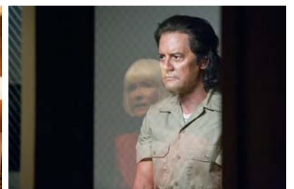
[1] The Straight Story et [2-3] Twin Peaks: The Return