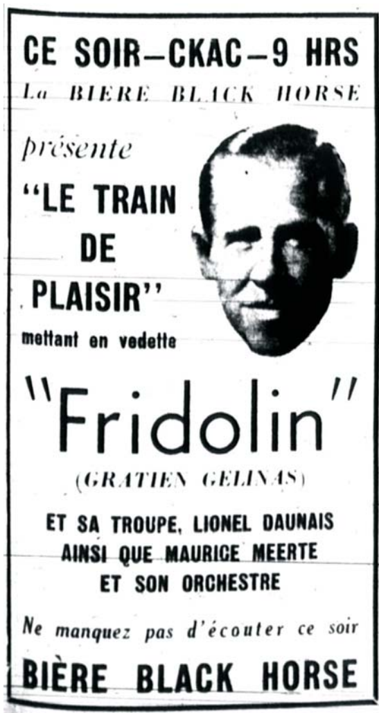
La Presse (14 septembre 1938): 24 (BANQ)