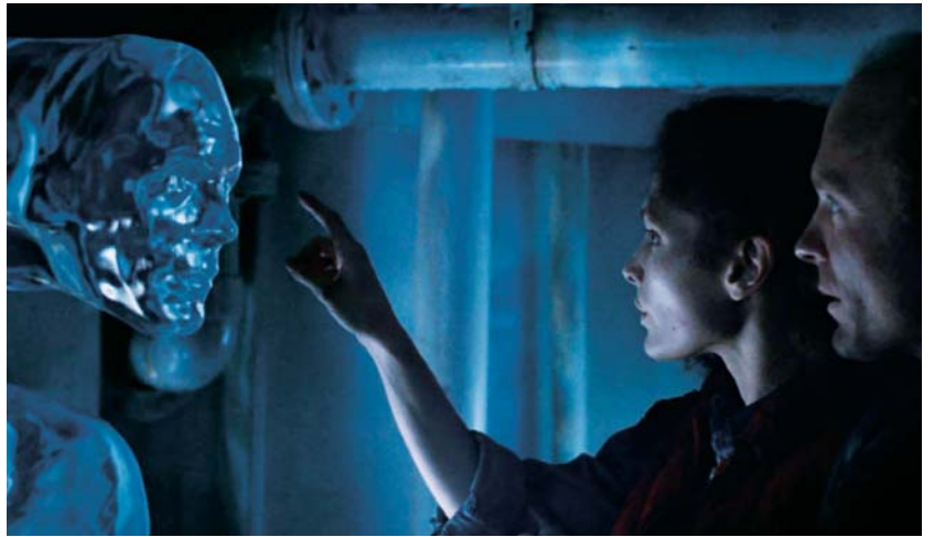
Arrival de Denis Villeneuve (2016) et The Abyss de James Cameron (1989)