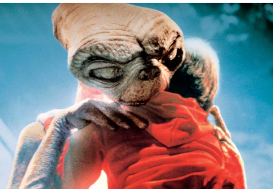
E.T. de Steven Spielberg (1982)

Dans cet art de la manipulation qu'est le cinéma (et dans l'art en général), l'effet de réel a toujours été la source de nombreux clivages. Voir la grande problématique de Platon et sa caverne, là où confortent et divertissent des ombres chatoyantes d'un réel extérieur bien plus complexe et inquiétant. De ce fait, en termes d'esthétique et de narration, beaucoup de choses ont changé dès la fin des années 1980. La roue a tourné et, indéniablement, les émotions en ont pris un coup. Du côté du cinéma d'auteur, l'influence des frères Dardenne se retrouve partout, surtout chez les jeunes cinéastes et ce, encore aujourd'hui. C'est le grand retour à un cinéma dit plus « dramatiquement vrai », plus « social ». Finie l'esthétique des sentiments. Finie l'influence de la pub et du vidéoclip. Terminée la musique qui