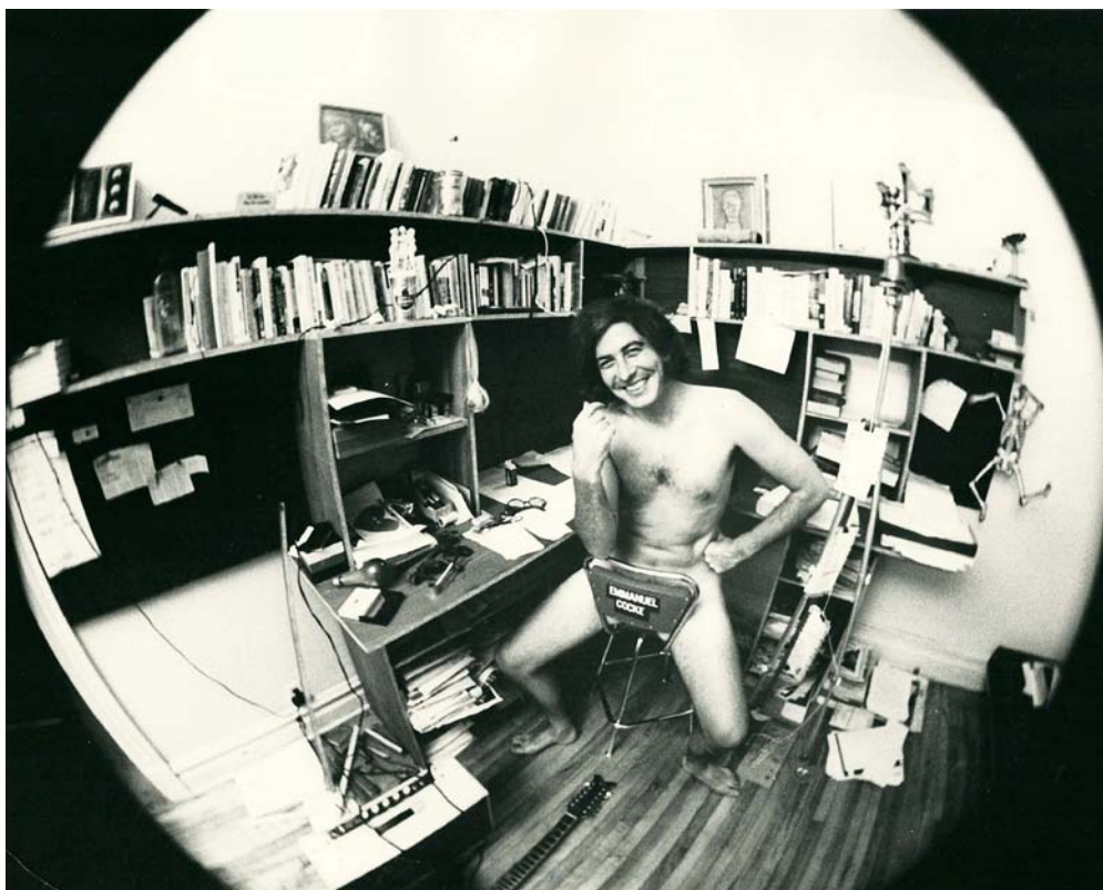
Archives de la famille Cocke