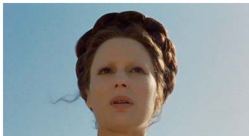
Porcherie, Théorème et Édipe Roi

à l'heure. Pour moi le théâtre, c'est tellement l'artifice, et c'est l'artifice aussi dans la manière dont la représentation théâtrale a lieu, dans ce truc incroyable où il y a des gens dans la salle et des gens sur le plateau; cela crée quelque chose d'unique. Ce qui me fascine aussi, c'est la façon dont les spectateurs entrent dans une salle. Au cinéma, il y a une première séance à 14h, une autre à 16h et une autre à 18h. Le siège sur lequel on s'assied sera foulé par 4 ou 5 personnes dans la même journée, alors qu'au théâtre, on sait que ce siège-là, il nous appartient pour la journée, voire pour l'éternité. Et puis, il y a cette question de la chose qui n'est pas reproductible. Le plaisir et le bonheur de l'acteur de théâtre, c'est qu'il sait qu'il peut chuter à n'importe quel moment, alors qu'au cinéma, il sait qu'il peut faire et refaire la prise. Et il y a aussi la responsabilité de l'acteur : une fois qu'il est en scène, l'acteur est totalement responsable de ce qu'il est en train de faire alors que l'acteur au cinéma livre quelque chose qui pourrait être complètement effacé, déplacé par le metteur en scène au montage.