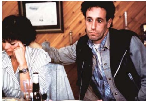
Le déclin de l'empire américain

l'ordonnement, la juxtaposition des scènes. On a recherché un effet beaucoup plus clippé, avec les deux masturbations qui se répondent au début, par exemple.