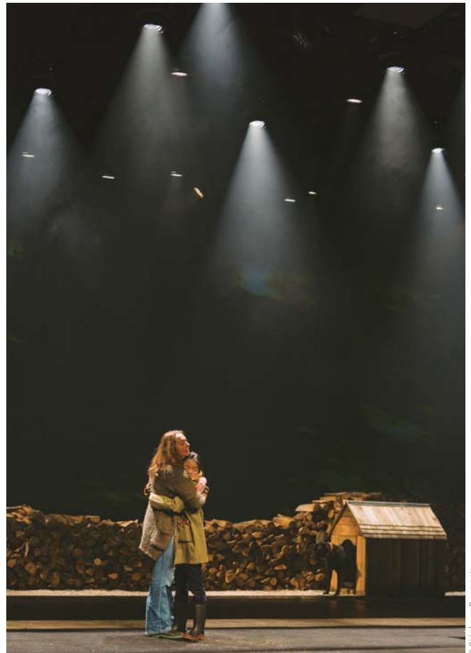
Les bons débarras