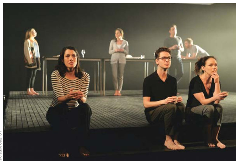
Le déclin de l'empire américain

il y a plus de scènes entre Ti-Guy et son ami Fernand, ces deux personnages qui errent. Ti-Guy est tout le temps là, mais on l'oublie parce qu'il ne parle pas. C'est lui qui regarde tout ce qui se passe et c'est lui, la victime. Dans l'œuvre de Ducharme, il y a souvent quelqu'un qui meurt, qui est largué. Manon est la plus adulte des adultes. C'est la plus dangereuse aussi, c'est le bourreau, c'est le monstre. Ce n'est pas elle la victime. Ces scènes-là ont été presque toutes coupées dans le film. Moi, je les ai toutes gardées, j'ai conservé cette idée de l'errance de Ti-Guy. C'est, en fait, un rapport amoureux entre Fernand et lui, entre ces deux hommes qui partagent leur détresse, l'alcool, le vide, le silence. Tout est tellement construit sur la langue, mais ici, le personnage principal, dans le scénario, c'est celui qui ne parle pas, qui est en marge. Il a donc fallu faire tout un travail dramaturgique. Le montage découpé du cinéma ne marche pas au théâtre, ça fait trop de courtes scènes. Il fallait trouver un souffle qui soit plus grand. Je me suis donc laissé beaucoup de liberté pour réorganiser la matière, trouver un autre ordre. Même si Ti-Guy était la trame, c'était Manon et sa mère qui m'intéressaient le plus. Ce que j'ai découvert aussi, c'est que la trame est calquée très grossièrement