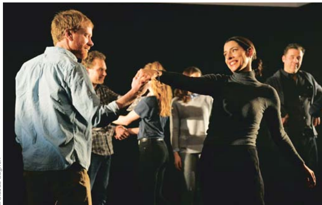
Le déclin de l'empire américain

sur Les Hauts de Hurlevent d'Emily Brontë. Manon lit ce livre, et c'est ça en fait : c'est l'histoire de quelqu'un qui aime une autre personne au point de tout détruire autour, quelqu'un qui se débarrasse des autres. J'ai travaillé là-dessus en remettant de l'avant l'idée des points de jonction avec Les Hauts de Hurlevent .