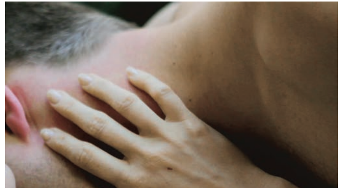
Butter on the Latch (2013)

Du film d'horreur, Decker retient jusqu'au bout la permanence d'une double menace : celle d'un possible affrontement entre Sarah et Isolde nourri par des rivalités et jalousies latentes ou celle encore d'une nature inquiétante, observatrice, peuplée d'énergies et de mythes inconnus d'où pourrait jaillir le pire. Il y a toujours une tension dans l'air, traduite par un montage qui alterne le silence et le bruit, l'intensité d'une caméra immersive et la profondeur tranquille d'une nature capturée dans sa nudité brute. Bien évidemment, les deux cinéastes n'excluent pas le monde animal : Decker filme les limaces, Arnold les chiens et les oiseaux. Dans cette nature, Decker déterre quelque chose de l'ordre de la transe, Arnold une véritable violence – des éléments que l'on retrouve habituellement dans les recoins les plus sombres des films de monstres ou de sorcières. Mais qui sont ces monstres finalement ? Ne sont-ils pas aussi l'une des facettes de ces femmes qui apprennent à cohabiter avec les ténèbres du monde des vivants comme avec celles des morts ? De celles qui apprennent à vivre avec leurs propres laideurs et démons ?