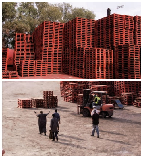
Dernier maquis (2008)

Oui, nous sommes des êtres somptueux. Arrêtons de nous considérer uniquement comme des tas de chair. Il y a au fond de