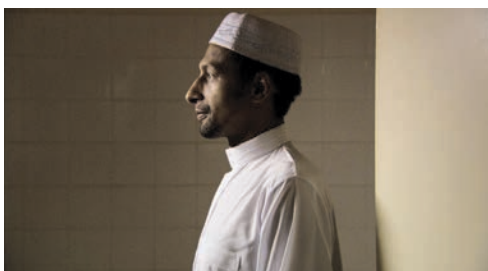
Histoire de Judas (2015) / Les chants de Mandrin (2011) / Dernier maquis (2008)

des bois. Avec leur système économique, nos sociétés sont dans la prédation qui se cache, qui essaie de faire de chacun d'entre nous une proie domestique. Moi, je préfère les petites brises, je préfère les animaux sauvages.