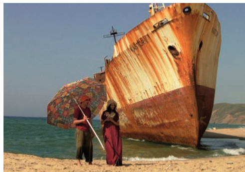
Bled Number One (2006)

Vous êtes présent dans tous vos films, comme pour faire advenir les rêves. Dans Bled Number One , il y a deux séquences où Rodolphe Burger joue de la guitare en pleine nature et vous êtes là, assis, comme une sorte de témoin décalé. Et en même temps, vous êtes solidaire de Louisa, cette femme victime des oppressions de sa société qui finit dans un hôpital psychiatrique. Il y a une douceur que l'on la retrouve dans tous vos personnages et votre façon de filmer. Bélissard dans Les chants de Mandrin est un rebelle, un agitateur qui lutte pour « la beauté des rêves ».