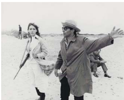
Anne Wiazemsky et Jean-Luc Godard sur le tournage de ONE + ONE (1968)