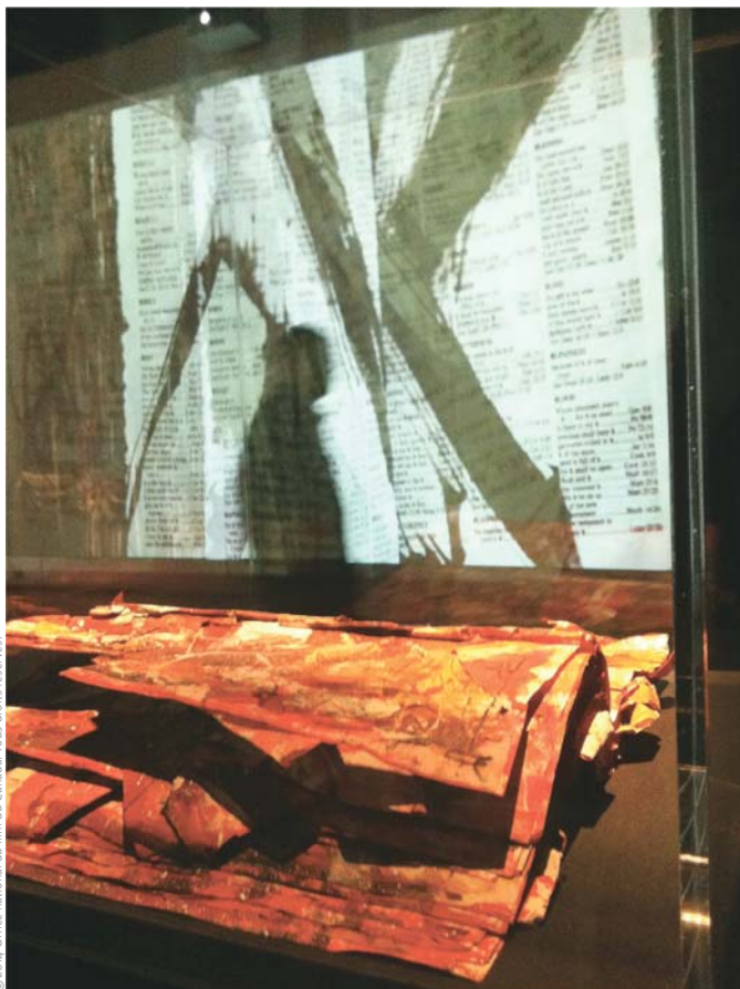
3 e PAGE APRÈS LE SOLEIL (2014)

C'est une question intéressante. Tu sais à cette époque, on était en pleine guerre froide et l'animation a servi aux artistes du bloc de l'Est pour s'exprimer, car on censurait beaucoup dans ces pays-là, et ils ont fait des films puissants avec des métaphores, des symboles. Aujourd'hui, on considère souvent que c'est un défaut de faire ça. Les politiciens dans ce temps-là regardaient le cinéma d'animation comme quelque chose de peu important, destiné aux enfants. Ils ne