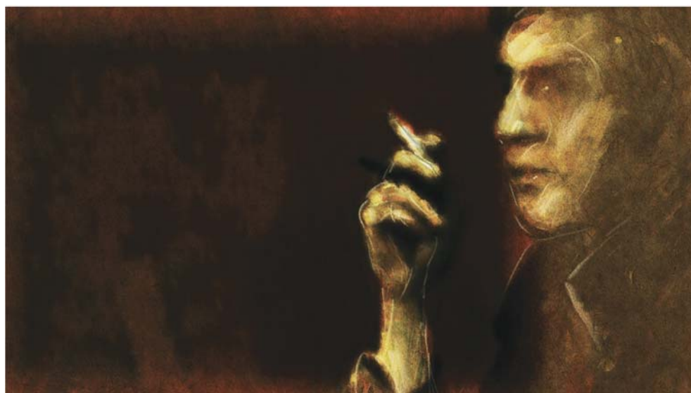
LES JOURNAUX DE LIPSETT (2010)

© 2010 Office national du film du Canada. Tous droits réservés.