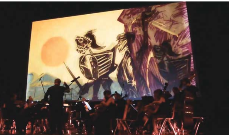
GLORIA VICTORIA, présenté en performance à Poznan, en 2013.