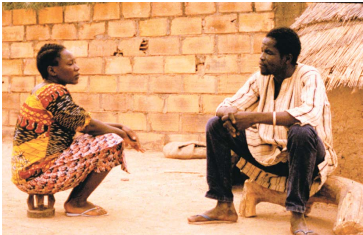
ZAN BOKO (1988) Gaston Kaboré

Il y a une quinzaine d'années eut lieu à la Cinémathèque québécoise une projection mémorable du film Zan Boko (Burkina Faso, 1988), en présence de son réalisateur Gaston Kaboré 1 . Dès les premiers dialogues en langue moré, la salle s'est agitée car la copie 35 mm, bien que très belle, ne comportait pas de sous-titres. Murmures d'inquiétude et soupirs de déception. Cependant, quelques minutes à peine après ce début chaotique, Kaboré proposait une solution lumineuse : empoignant un micro, il nous ferait lui-même, de sa belle voix et depuis l'intimité partagée de la salle, sa propre traduction live (et combien vivante!) de tous les dialogues. Ce fut magique. Sans doute étais-je dès le départ émue d'assister au film en présence de Kaboré ; il est toujours impressionnant, lorsqu'on admire le travail d'un cinéaste, de vivre avec lui la projection de son film, à plus forte raison lorsqu'il vient de loin – dans ce cas précis d'une région de l'Afrique que j'affectionne particulièrement et où faire un film relève déjà du miracle. Mais j'ai été transportée de façon si singulière par ce double événement (le film, la présence du