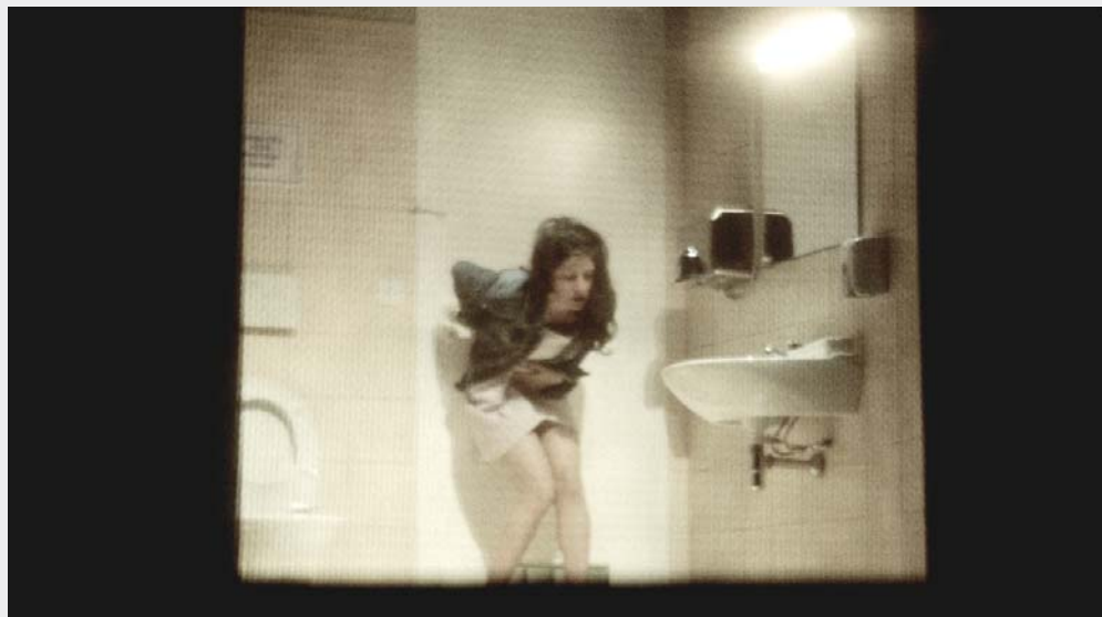
GO DOWN, MOSES (2014)

«Une image, c'est quelque chose qui nous appelle. Même dans la solitude face à un livre, même en lisant, il s'agit de formes d'appel. Chaque forme esthétique, chaque esthétique produit un spectateur. On ne peut pas dire ça face à la nature par exemple. On n'est pas spectateur dans la nature. Dans nos villes, on est des spectateurs. Dans nos maisons, on est toujours des spectateurs. On est entouré par le spectacle. Des choses à lire, des choses à voir, des choses à écouter, en continu. La condition de spectateur est devenue en cette époque une condition existentielle et politique. C'est LA condition.»