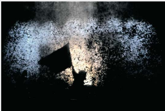
THE FOUR SEASONS RESTAURANT (2012)

Les frontières entre les arts ont créé des modes de vision et d'écoute différents. Nous ne sommes pas seulement un regard, mais aussi une écoute. Bien sûr, le cinéma. Le cinéma, encore et toujours. En réalisant actuellement un triptyque vidéo consacré à Romeo Castellucci, je découvre à quel point le cinéma habite l'œuvre de ce très grand artiste italien. Pas le cinéma en tant qu'images, le cinéma comme système nerveux .