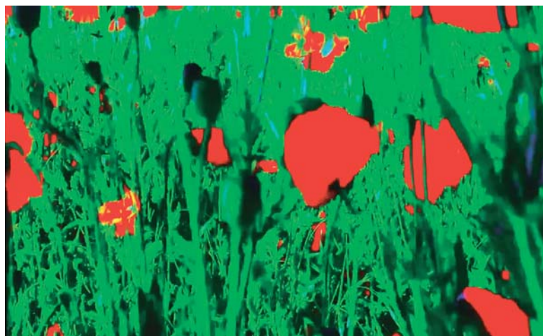
ADIEU AU LANGAGE (2014) Jean-Luc Godard

eux. Peut-être suffisait-il à Monica Vitti d'être aussi belle pour que Antonioni imagine Le Désert rouge . Peut-être croyons-nous, à cause de l'extrême sidération provoquée par la surprésence industrielle de tous ces produits injectés de force dans nos regards et nos cerveaux , que cela n'est plus possible. Mais ce n'est pas vrai. Le temps s'est tellement accéléré que l'histoire, aussi, s'accélère. Ce qui hier prenait plusieurs siècles pourrait surgir tout à l'heure en quelques années.