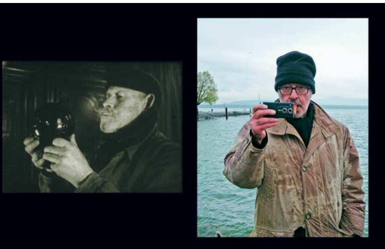
LE TEMPESTAIRES (1947) Jean Epstein. Jean-Luc Godard

3 La puissance pure de la toute dernière mutation du cinéma, le dernier cri de la modernité, apparue dans les années 1980-1990, a tout cassé. Aucun scoop. Juste un constat honnête et visible par tous. Que nous soyons cinéastes, producteurs, distributeurs, exploitants, télévisions, critiques, spectateurs. Sans faire d'histoires. Cette mutation est même apparue aux yeux de beaucoup comme hautement désirable, comme un grand pas démocratique vers ce qu'elle appelle une véritable démocratie : un monde enfin débarrassé de l'Histoire, entièrement dominé par le marché. Étrange connexion. Le cinéma pourrait continuer à vivre dans un monde où l'histoire aurait cessé d'exister ? Que dire alors des peuples, qui depuis Chaplin, Eisenstein, Ford, Pasolini, ont toujours été les plus grands héros du cinéma. Les regardons-nous encore