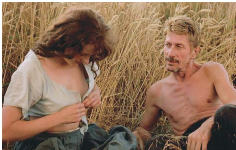
MES PETITES AMOUREUSES (1973) de Jean Eustache et VAN GOGH (1991) de Maurice Pialat