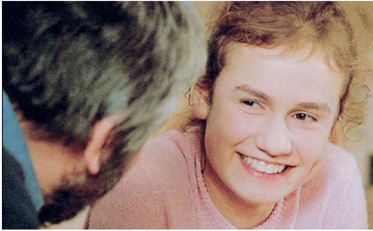
Sandrine Bonnaire dans À NOS AMOURS (1983)

et un peu bavarde est en fait un tour de force. Pialat n'a jamais cédé à la tyrannie de la logique de la fiction traditionnelle, et ne sert au contraire que celle de la vie. La logique sans logique de la vie. Comme Tarkovski s'est baladé avec aisance et à sa façon avec celle du rêve et de la mémoire dans Le miroir . Voilà toute la différence. Il s'agit sans doute de l'un des plus beaux films sur l'adolescence, et sans doute de l'un des portraits les plus justes et vrais d'une jeune fille post-révolution sexuelle. Ceux et celles croyant qu'un homme d'un certain âge (Pialat avait 58 ans) ne peut réaliser un film sur une jeune fille sans sombrer dans une forme de complaisance secrètement libidineuse peuvent aller se rhabiller. À nos amours ne se limite pas qu'à la découverte d'une actrice d'exception dont le miracle de la performance ne se reproduira plus. Je me corrige tout de suite: il n'y pas de performance dans le jeu des acteurs chez Pialat. C'est une présence vivante, jamais exagérée ni poussée, on n'a pas besoin d'enflures quand on est capable d'insuffler à ses acteurs la grâce de n'être que vivant, alerte, spontané, fébrile, sur le qui-vive de l'inattendu. Jamais Bonnaire et Depardieu n'ont été aussi naturels et vivants que chez Maurice Pialat.