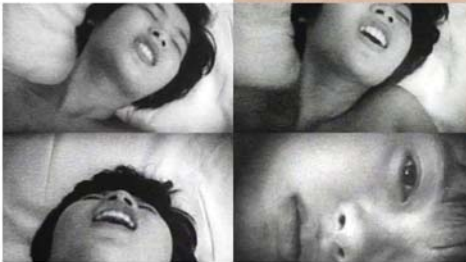
EXTREME PRIVATE EROS KAZUO HARA