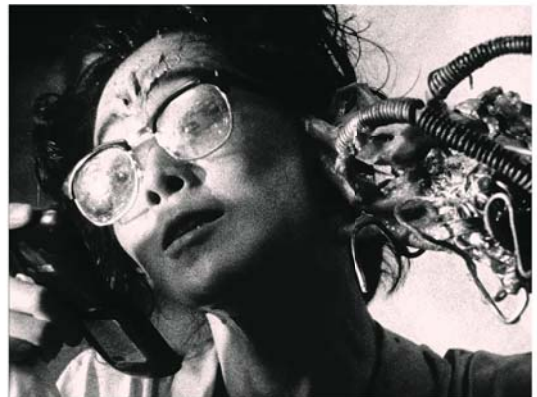
TETSUO SHINYA TSUKAMOTO